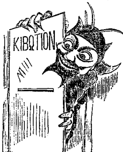
Κέρτε Συντάκτα τοῦ «Ἀσμοδαίου.»