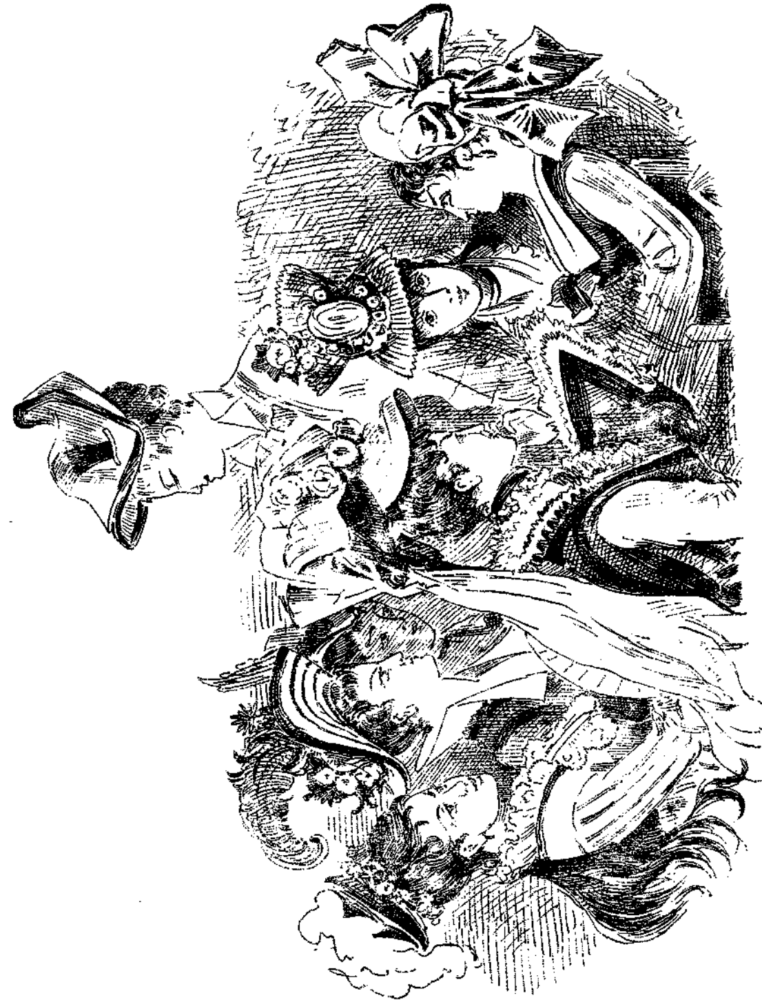
Παρθενική ἀνθοδέσμη ἐξ ἧς πρόκειται νὰ ἐκλέξῃ ὁ κ. Peacock.