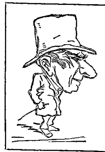
Ἀπαραίτητος εἰς εὐδῶσιν μεταλλευτικῆς ἐταιρίας