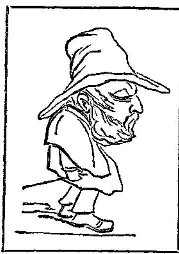
Ἀπαραίτητος εἰς ἀρχαιολογικὸν μουσεῖον