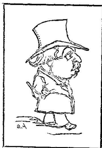
Ἀπαραίτητος εἰς συμπλήρωσιν τῆς δόξης τῆς ἱατρικῆς σχολῆς