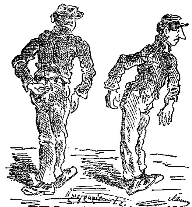
Τί θὰ γείνη τὴν Σαρακοστήν