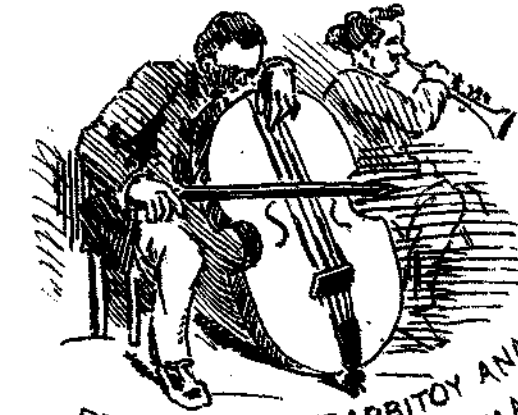
ΠΕΡΙΤΟΜΗ ΒΑΡΥΒΑΡΒΙΤΟΥ ΑΝΑΓΚΑΙΑ ΧΑΡΙΝ ΤΗΣ ΘΕΑΣ ΤΩΝ ΕΝ ΤΗ ΠΛΑΤΕΙΑ