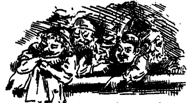
ΟΙ ΟΛΒΙΟΙ ΤΟΥ ΠΑΡΑΔΕΙΣΟΥ