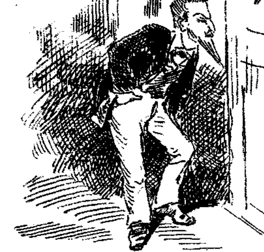
ΑΚΡΟΑΤΗΣ ΤΟΥ ΣΟΡΙΑ ΜΕΙΝΑΣ ΕΞΩ ΚΑΙ ΤΟΥ ΠΑΡΑΔΕΙΣΟΥ