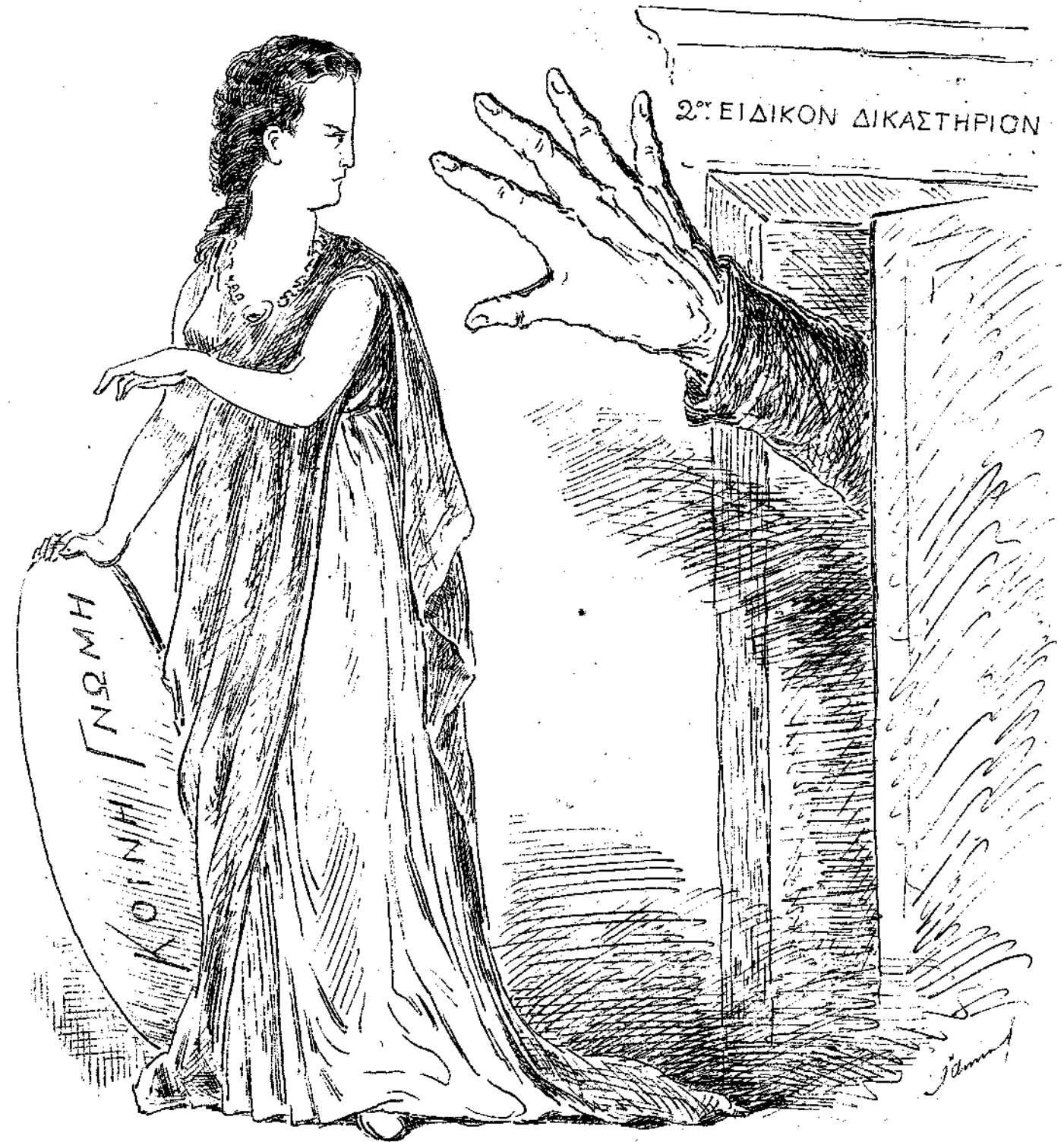
ΕΙΔ. ΔΙΚΑΣΤΗΡΙΟΝ. Ἡ δίκη τοῦ Βούλγαρη ἀναβάλλεται ἐπὶ πέντε μῆνας. ΚΟΙΝ. ΓΝΩΜΗ. Τέτοια τύφλα ἀπὸ σέ δὲν τὴν ἐπερίμενα.

Ἄν αἱ δυνάμεις τῆς Εὐρώπης παρεδέχθησαν τῷ ὄντι τὸν νέον τοῦτον χειρισμὸν τοῦ ὅπλου, νομίζομεν ὅτι ἔχομεν δικαίον νὰ κοιμώμεθα ἐν εἰρήνῃ, ἀσφαλεῖς ἄντες, ἀπὸ πάσης σφαίρας.