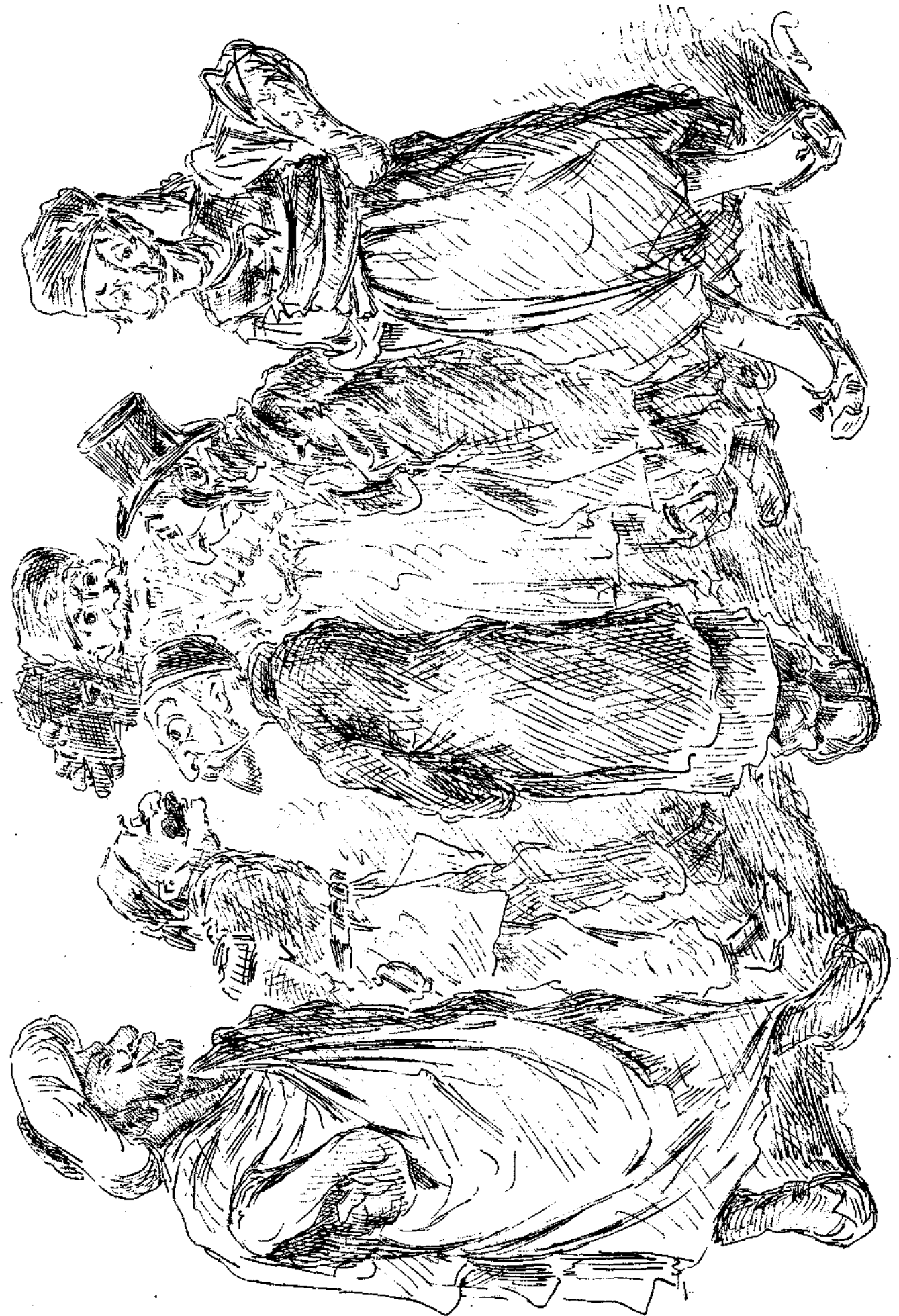
Τύποι τῆς μελλούσης Τουρκικῆς Βουλῆς.

Θ' ἀπορήσης βεβαίως μανθάνων παρ' ἐμοῦ ἤδη, ἂν ὡς ἐκ τῆς διαβολικῆς φύσεώς σου δὲν τὸ γνωρίζεις, ὅτι καὶ ἐν τῇ πρωτεύουσῃ τῆς ἡμετέρας Νήσου, τὸ Ἄργοστόλιον, ὑφίσταται πρὸ ἔτους Σύλλογος τιτολοφορούμενος «Φιλο- πρόδος σύλλογος ἢ Ἡώς». Ἐχεις δὲ δίκαιον ν' ἀπορή- σης καὶ τοσούτῳ μᾶλλον, καθόσον καὶ αὐτοὶ οἱ ἐν Ἄργο- στολίῳ καὶ οὐχὶ εἰς τοὺς ἀντίποδας οἰκοῦντες ἠγνόνουν μέ- χρι τοῦδε τὴν ὑπαρξίν τοῦ τοιοῦτου ἐν τῷ μέσῳ αὐτῶν εὐ- ρισκομένου φιλολογικῆς θησαυροῦ, περὶ οὗ χθὲς μόνον διὰ προσκλητηρίου τοῦ κ. Προέδρου ἔμαθον ὅτι ἐορτάζει δῆ- θεν σήμερον τὴν ἐπέτειον αὐτοῦ ἐορτῆν.