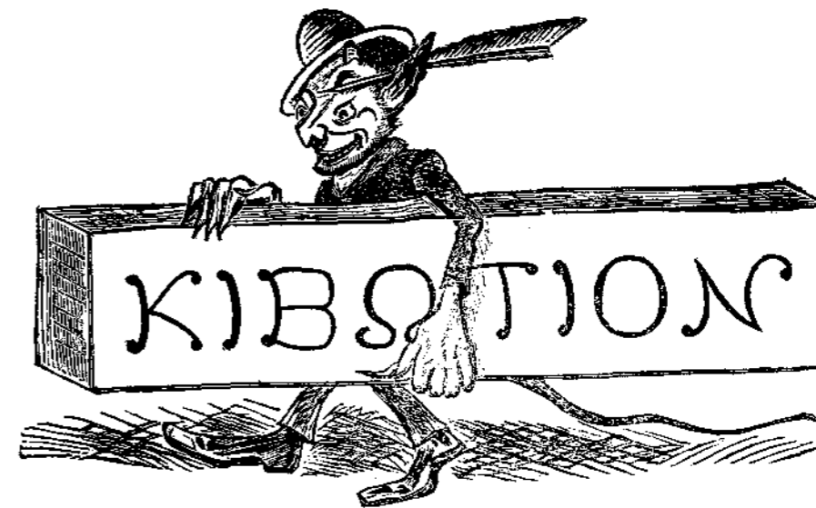
(Συνέχεια τοῦ ἀριθμοῦ 77.)

Γράφων ταῦτα οὔτε προφήτου δοῖξαν θηρεύει ὁ « Ἀσμοδαίος », οὔτε ἄσκοπα δάκρυα ἐπὶ τῶν τετελεσμένων ἔρχεται νὰ χύσῃ. Τοῦτο δὲ μόνον παρατηρεῖ, ὅτι καὶ σήμερον ἀκόμη, ὅτε ἐπέστη ἡ ὀδυνηρὰ ὥρα, καθ' ἣν ἀποτίομεν δι' αἰσχύνης καὶ ταπεινώσεως τὴν παρελθούσαν ἀβουλίαν, οὐδαὶ θέλει ν' ἀντιμετωπίσῃ μετὰ θάρρους τὴν ἀληθῆ αἰτίαν τοῦ κακοῦ. Οἱ μὲν μέμφονται τοὺς παρόντας ὑπουργούς ὡς μὴ παρασκευάσαντας τὸ ἔθνος, ὡς ἂν ἦτο δυνατόν νὰ παρασκευασθῇ τοῦτο ἐντὸς ἐξαμηνίας ἀνευ οὐδενὸς πρὸς παρασκευὴν μέσου. Οἱ δὲ, ὡς χθὲς ὁ κ. Δεληγεώργης, ὁμιλοῦσι περὶ τῆς ἐπιζημιῶν τῆς Κυβερνήσεως ἐξωτερικῆς πολιτικῆς, λησιμονεῦντες ὅτι ἡ ἐξωτερικὴ πολιτικὴ ἔθνους τινὸς οὐδὲν ἄλλο εἶναι εἰμὴ ἡ ὑπόδειξις παρ' αὐτοῦ πρὸς τὰ ἄλλα ἔθνη ὅτι οὕτως ἢ ἄλλως σκοπεῖ νὰ διαθέσῃ τὰς δυνάμεις του, ὅπου δὲ δὲν ὑπάρχουσι δυνάμεις, οὐδ' ἐξωτερικὴ πολιτικὴ, οὔτε καλὴ οὔτε κακὴ, δύναται νὰ ὑπάρξῃ. Πάντα ταῦτα νομίζομεν περιτολογίας, τὸ δὲ ἀληθὲς καθ' ἡμᾶς ζήτημα εἶναι τοῦτο: ὅτι οὐδεμία κυβερνήσις δύναται νὰ ὑπάρξῃ ἐν Ἑλλάδι χωρὶς ν' ἀγοράσῃ τὴν ἀναγκαίαν πρὸς ὑπαρξίν αὐτῆς πλειονοψηφίαν, οὐχὶ διὰ τῆς θυσίας μέρους μόνου τοῦ προϋπολογισμοῦ, ὡς γίνεται ἄλλαχού, ἀλλὰ δι' ὀλοκλήρου τοῦ προϋπολογισμοῦ καὶ διὰ δανείων ἀκόμη. Ἐκ τῆς ἀνέκαθεν καθιερωθείσης τοιαύτης διαθέσεως τοῦ Ἑλληνικοῦ προϋπολογισμοῦ ἀδύνατον εἶναι νὰ ὑπεξαιρεθῇ τὸ παραμικρὸν πρὸς οἰονδήποτε ἔθνος ἐλλείπον διότι πᾶσαν τοιαύτην ἀπόπειραν ἤθελεν ἀκολουθήσει τὴν ἐ-