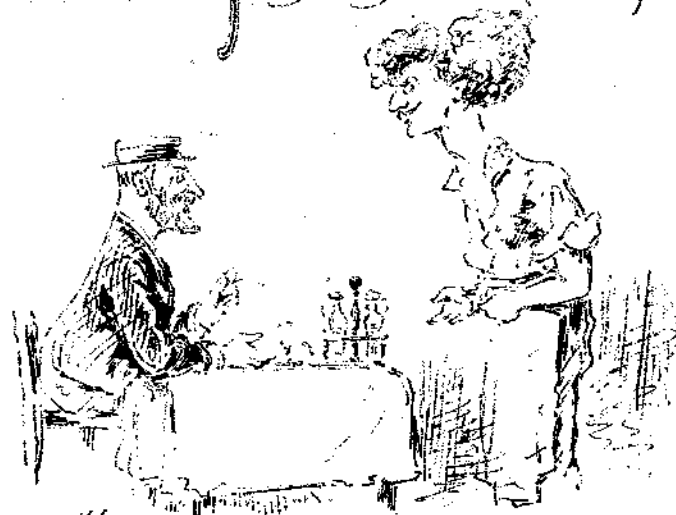
Μία τσίχα. Μισήν ούραγιά! Ημ' ήσ' είσ' αώμε' ε' τίν' ούγι!