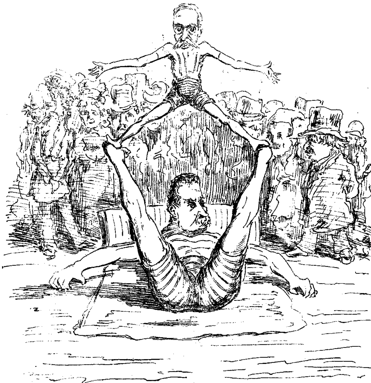
Μέλλουσα κυβερνητικὴ ἰσορροπία.

Εἰς τὴν ἀνάπτυξιν ταύτην τοῦ τί ἐννοοῦμεν διὰ τῆς λέξεως ἀγέλη προέβημεν ἀποχαιρετῶντες σήμερον τὴν δημοσιογραφίαν, διότι παρεξηγοῦντές τινες ἡμᾶς ὑπέθεσαν ὅτι τὸ ὄνομα τοῦτο ἀποδίδομεν εἰς αὐτὴν τὴν Βου-