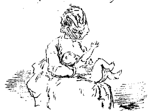
Αιμακόντι ή τώ πορρομμιαί