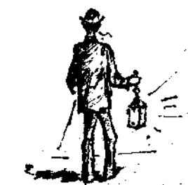
Τὸ προχειρότερον μέσον μεταβάσεως ἐν Ἀκρόπολιν ἀμα ἀγγελῆ ὁ δι' ἠλεκτριμοῦ φωτός σιτισμός της.