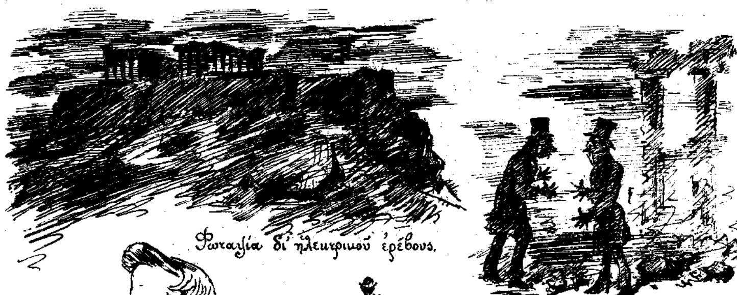
Φωταψία δι' ἠλεκτριμοῦ ἑρέβου.

Μεταξὺ δημηρέτου καὶ δημηρετριάς. — Τί ἀνάβουν φῶτα πάλιν εἰς τὴν Ἀκρόπολιν; — Κάμουν συμβούλιο οἱ γιατροὶ καὶ θέλουν νὰ βλέπουν. — Μεταξὺ δύο Ἀθηναίων. — Δὲν βλέπεις βετσίνας; τί ἤλεκτρικὸν φῶς μοῦ κουβεντιάζεις; — Κουτέ! Ἡ βετσίνα εἶνε ἑλληνικὸ ἤλεκτρικὸ φῶς. (Ἱστορικά).