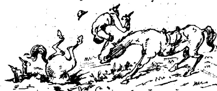
Ma chasse aux papiers.