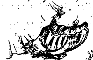
Ή ενδρου κορδῆς