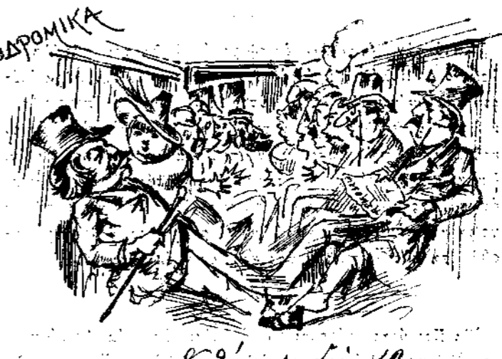
8 διούσι δια 12