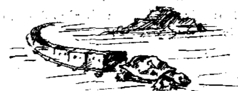
Άντικρὺ τῆς locomotive