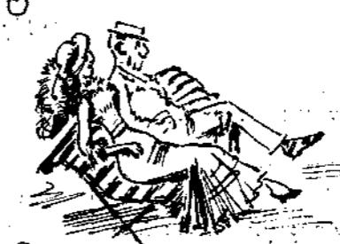
Διαταί γαμμινὸν διαζυγιόν