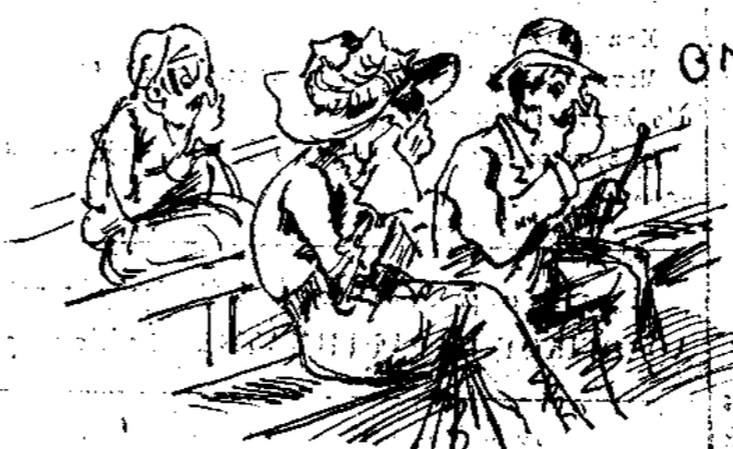
Διαταί γαμμινὸν διαζυγιόν