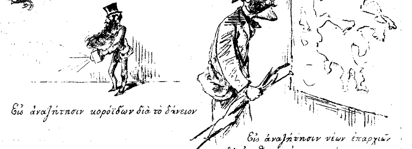
Εἰς ἀναψήτῃσιν μοροῦδων διὰ τὸ δάνειον