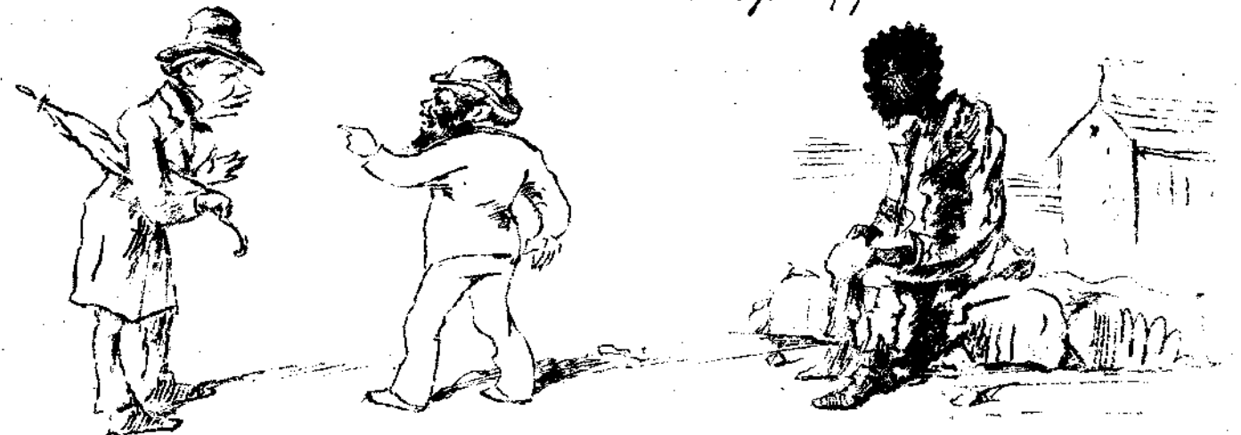
Εἰς ἀναψήτῃσιν νέων ἐπαρχιῶν δι' ἀγαθοεργούς σοποῦς