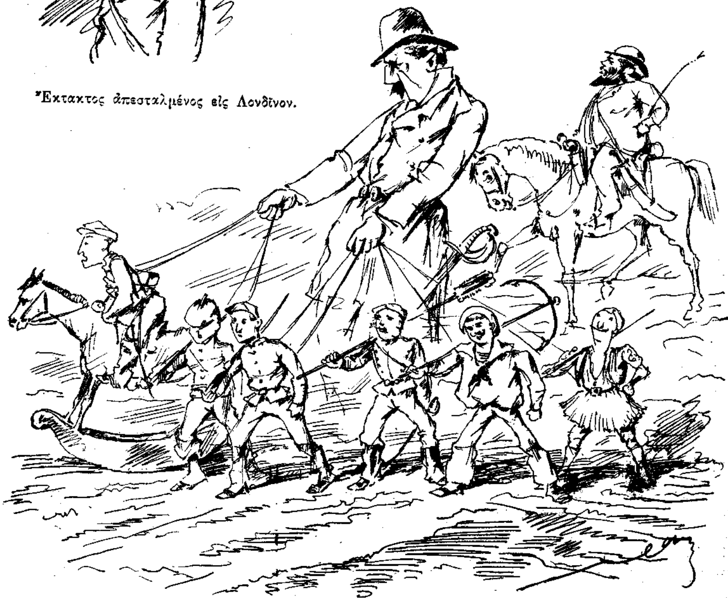
Πώς θα ξεκινηθήσῃ.