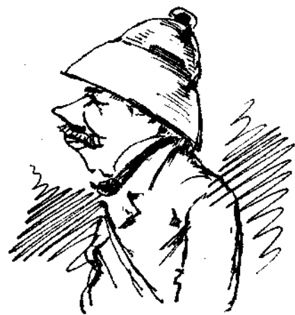
*Εκτακτος ἀπεσταλμένος εις Λονδίνον.