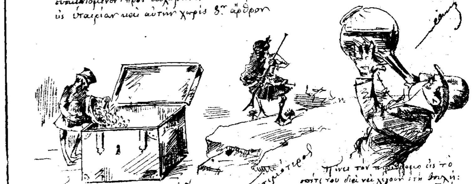
Ταπεινὸν πρὸς ἐξέλιπον μὲδύχων καὶ σιναχίαν ἀνθρωπαρίων