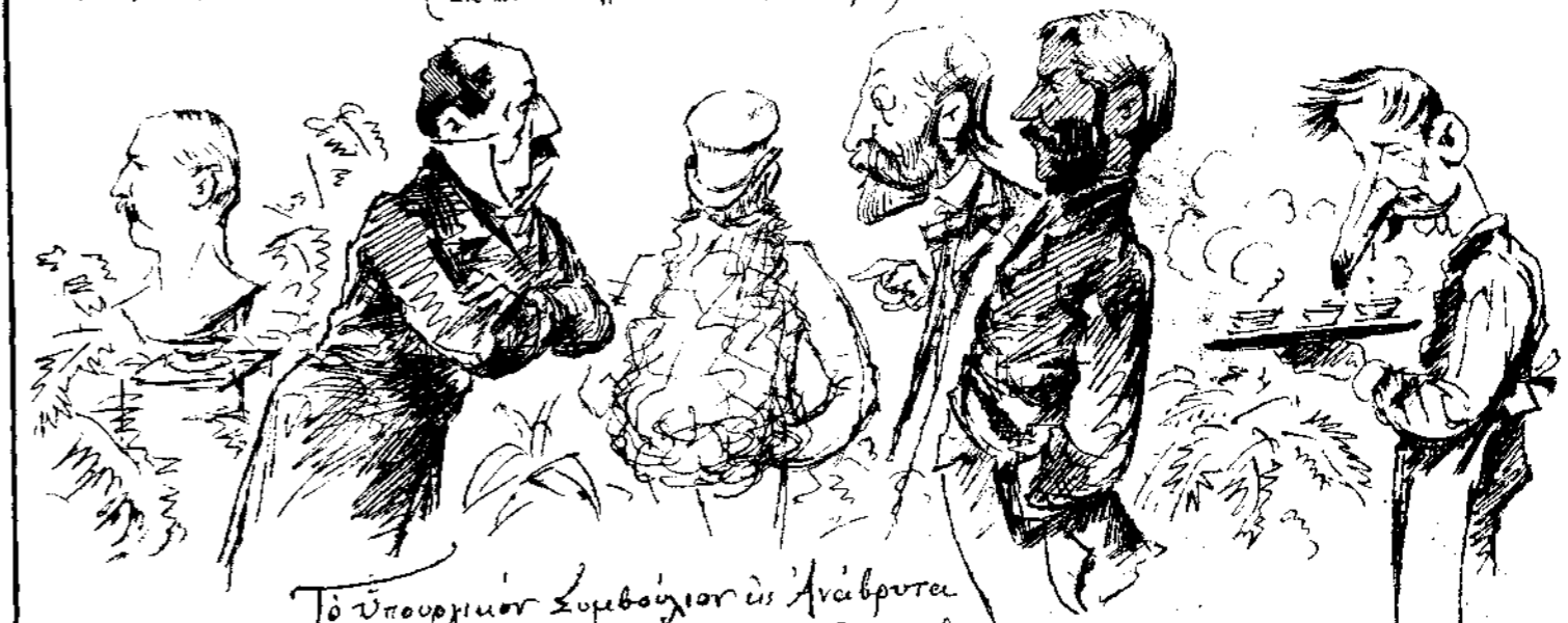
Τὸ ὑπουργίον Συμβούλιον εἰς ἀνάβρυστα συμπιδομένοι πρὸς ἀχώρησιν τοῦ Παρδενῶνα εἰς ὕψαιαν καὶ αὐτὴν χωρὶς 8 ον άρθρον