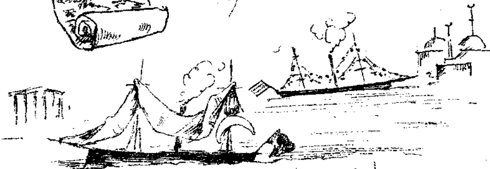
Ανταλλαγή παρβάνημων άσχημων