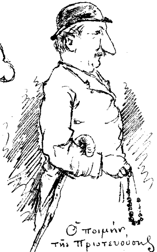
Ο ποιμήν της Πρωτεύουσῃς