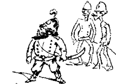
Le general Cossonai (Νέα γοη ή Αφρονείας)