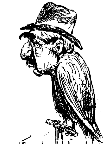
Γενικός άπόφορος δαιωννής άιτωχο-άμαρνανίας