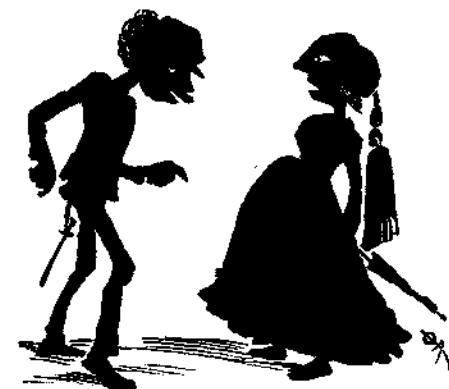
ΚΑΙΝΟΘΗΡΙΑ ΣΚΗΝΗ Α'.