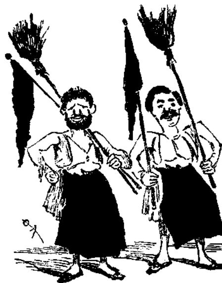
Παρτοπόλαι Τριπόλειος ἐπὶ τῆς ὑποδοχῆς