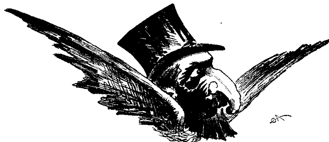
Εἰς οὐρανὸς κάκιστος...