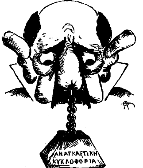
Μέχρι τῆς 1ης Ἰανουαρίου 1885 (Tempo permettendo)