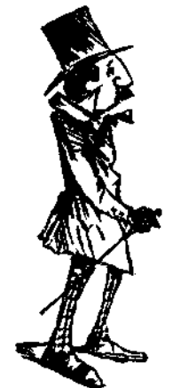
Ὁ νεαρὸς ἀσπὴρ τῆς ἀνατολῆς ἐν Λονδίῳ