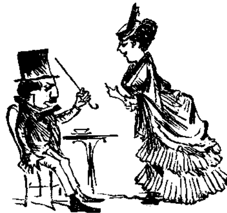
Δὲν ἠγάπα τὸ φυσικὸν ὄρατον Ν. Π.