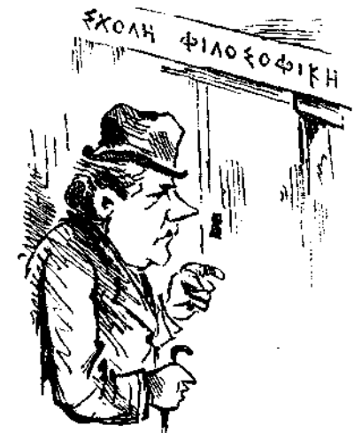
Τῷ κροῦντι οὐκ ἀνοίγησεται