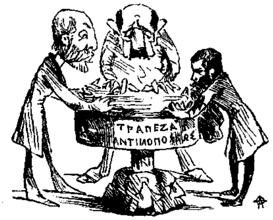
Eppur si muove