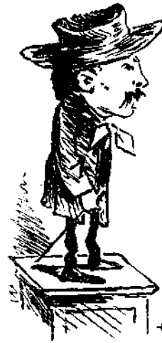
Τώρα δίχως διαμαρξία Μόνον σοῦμενε τὰ λέξ Περασμένα μεγαλεῖα Καὶ διηγῶντάς τα τὰ κλαῖς.

Εἰς τὸ δεύτερον τοῦτο καταγίνεται μετὰ πυρετώδους σπουδῆς ἡ κυβέρνησις.