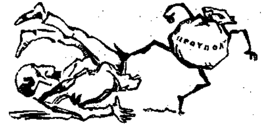
Περίληψις πρακτικῶν ἐν τῇ Βουλῇ