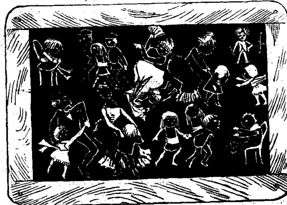
Ἐντυπώσεσις τοῦ μικροῦ Ἀλέκου ἐν τῷ ἀνακτορικῷ χορῷ