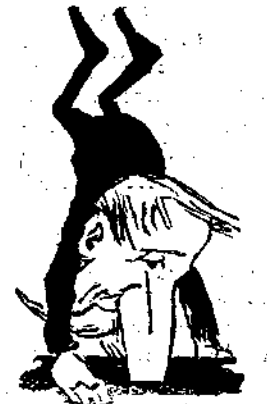
Καὶ εἰς τὰ λιμενικὰ Κατακόλω