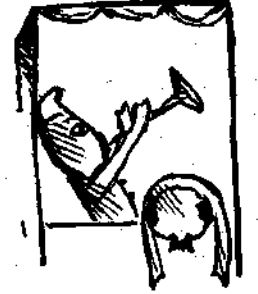
Σκηνὴ ἀποκρηάτικη Περικλήτου καὶ Τρικουπέτου ἀπολήξασα εἰς τὸ God save the Queen