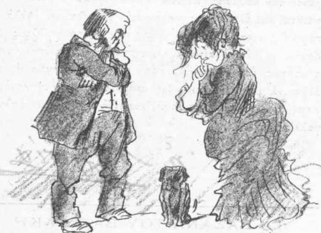
Τύπος οἰκογενείας βεβαρυμένης ἀπὸ τὰ δαινὰ τοῦ ψευδοπολέμου.