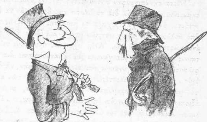
— Ἐρρετε εἰς κόρακας μετὰ τὴ βουλή σας! — Σὺ εὐτυχῶς τὸν ἐβγάλες τὸν κόρακα ἐπὶ τέλος.