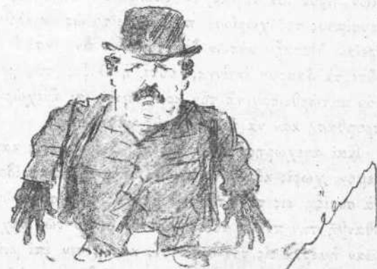
Νέα φάσις τοῦ προικεμένου γνωστοῦ τύπου.