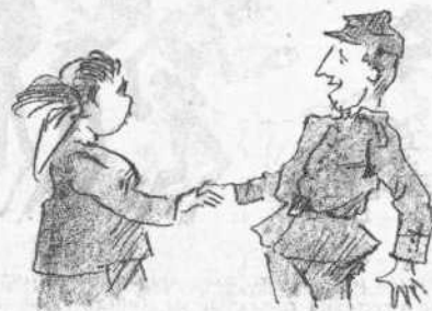
— Ἐχε γειά. Εἶμαι γιὰ τὸν πόλεμο. — Τὸν ἀληθινὸ ἢ τὸν ψεύτικο;