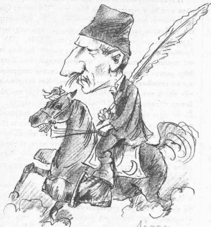
Ὁ ἐν Ἀθήναις ἀπεσταλμένος τῆς Πύλης Λάππα σοφτᾶς

Ὁ ἐχθρὸς παρετάχθη εἰς τρία κέρατα καὶ δύο πτέρυγας ἐνῶ ὁ ἄλλος ἐχθρὸς ἐσχηματίσθη εἰς δύο κέντρα. Ἀμέσως τότε τὸ ἱππικὸν κατεσκευάσε τὰ ταχύσκαπτα καὶ τὸ πυροβολικὸν ἐφόρμησε διὰ τῆς λόγῃς. Εὐθύς τὸ ἐν κέντρον ἀπεσπάσθη ἐνεκα τῆς κεντροφύγος δυνάμεως καὶ συνέλαβεν αἰχμαλώτους ὅλους τοὺς ἐπικούρους ἰατροὺς. Καὶ οἱ δύο ἐχθροὶ ἠττήθησαν κατὰ κράτος. Ὁ Σταυρὸς ἐγενεῖν ἐρυθρὸς ἀπὸ τὸ αἷμα καὶ διὰ τοῦτο οἱ νοσοκόμοι ἀνομάσθησαν τοῦ Ἐρυθροῦ Σταυροῦ.