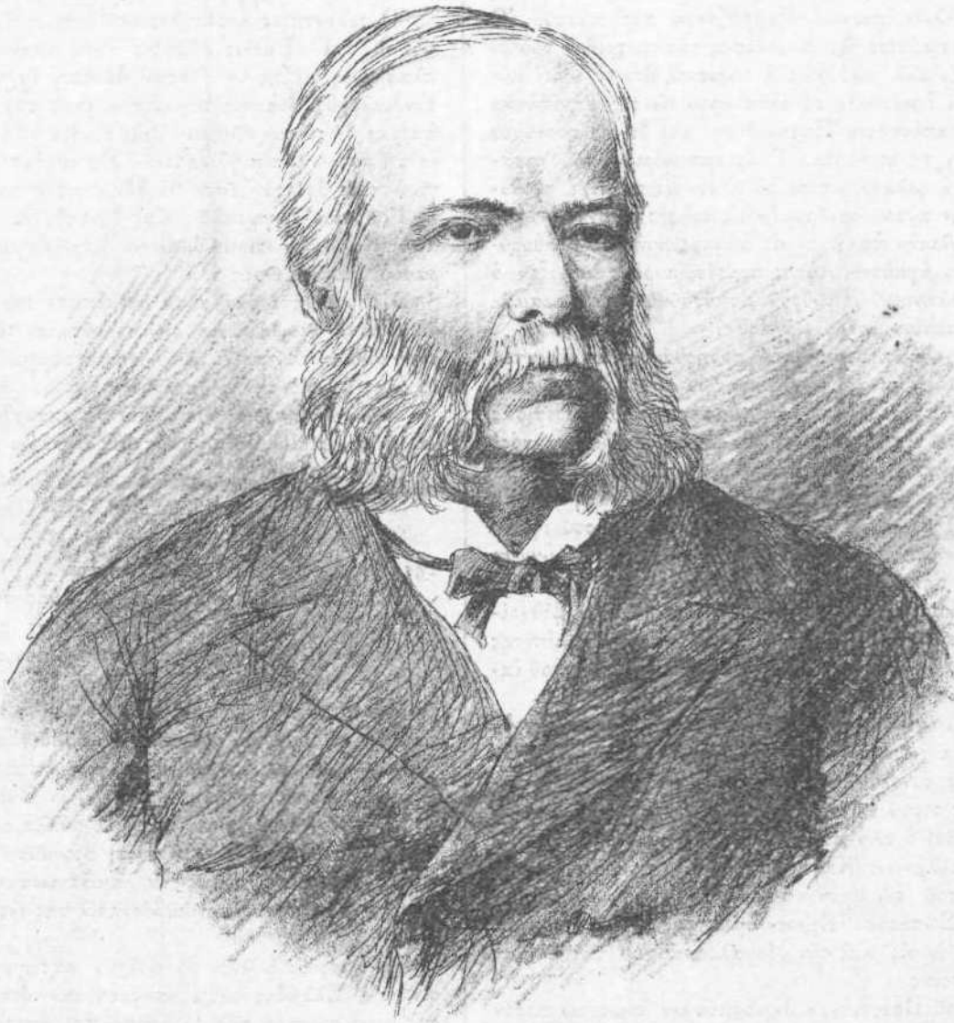
ΧΑΡΑΛΑΜΠΟΣ ΤΥΠΑΛΛΟΣ ΠΡΕΤΕΝΤΕΡΗΣ

Δεινὴν καὶ ἀνεπανόρθωτον ἀπώλειαν ὑπέστη ὁ ἐπιστημονικὸς κόσμος τῆς Ἑλλάδος κατὰ τὰς τελευταίας ἡμέρας τοῦ λήξαντος ἔτους. Ὁ πρύτανις τῶν παρ' ἡμῖν κλινικῶν, ὁ ἐπιφανὴς καθηγητὴς τοῦ Πανεπιστημίου καὶ ἀρχίατρος τῆς βασιλικῆς οἰκογενείας Χαράλαμπος Τ. Πρετεντέρης ἀπέβιωσε τὴν νύκτα τῆς 29 πρὸς τὴν 30 Δεκεμβρίου ἐκ τοῦ κατατρώχοντος αὐτὸν πρὸ καιροῦ καρδιακοῦ νοσήματος.