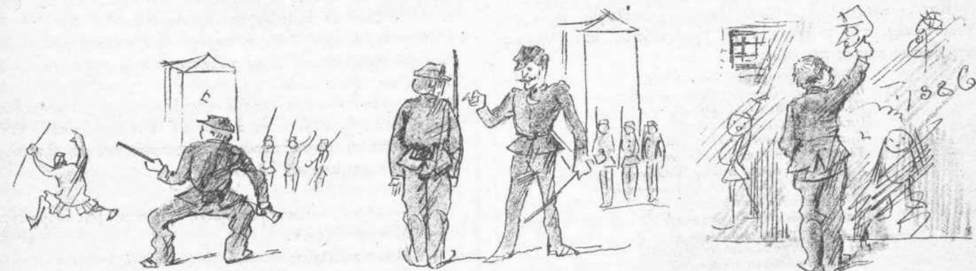
Εἰς τὰ ὄπλα!...