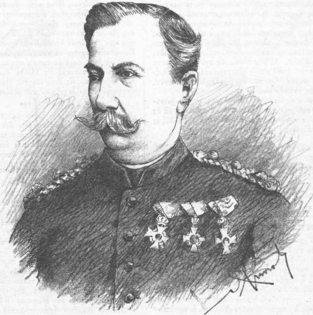
Ο ΔΙΟΙΚΗΤΗΣ ΤΟΥ Γ'. ΑΡΧΗΓΕΙΟΥ ΣΠΥΡΙΔΩΝ ΚΑΡΑΪΣΚΑΚΗΣ

Ὁ Σπυρίδων Καραϊσκάκης ἐγεννήθη ἐν ἔτει 1825, ἐκ πατρὸς τοῦ ἐνδόξου Γεωργίου Καραϊσκάκη καὶ ἐκ μητρὸς τῆς Ἐγκολπίας, ἀνηκούσης εἰς τὴν ἀρματολικὴν οἰκογένειαν τῶν Σκυλοδήμων.