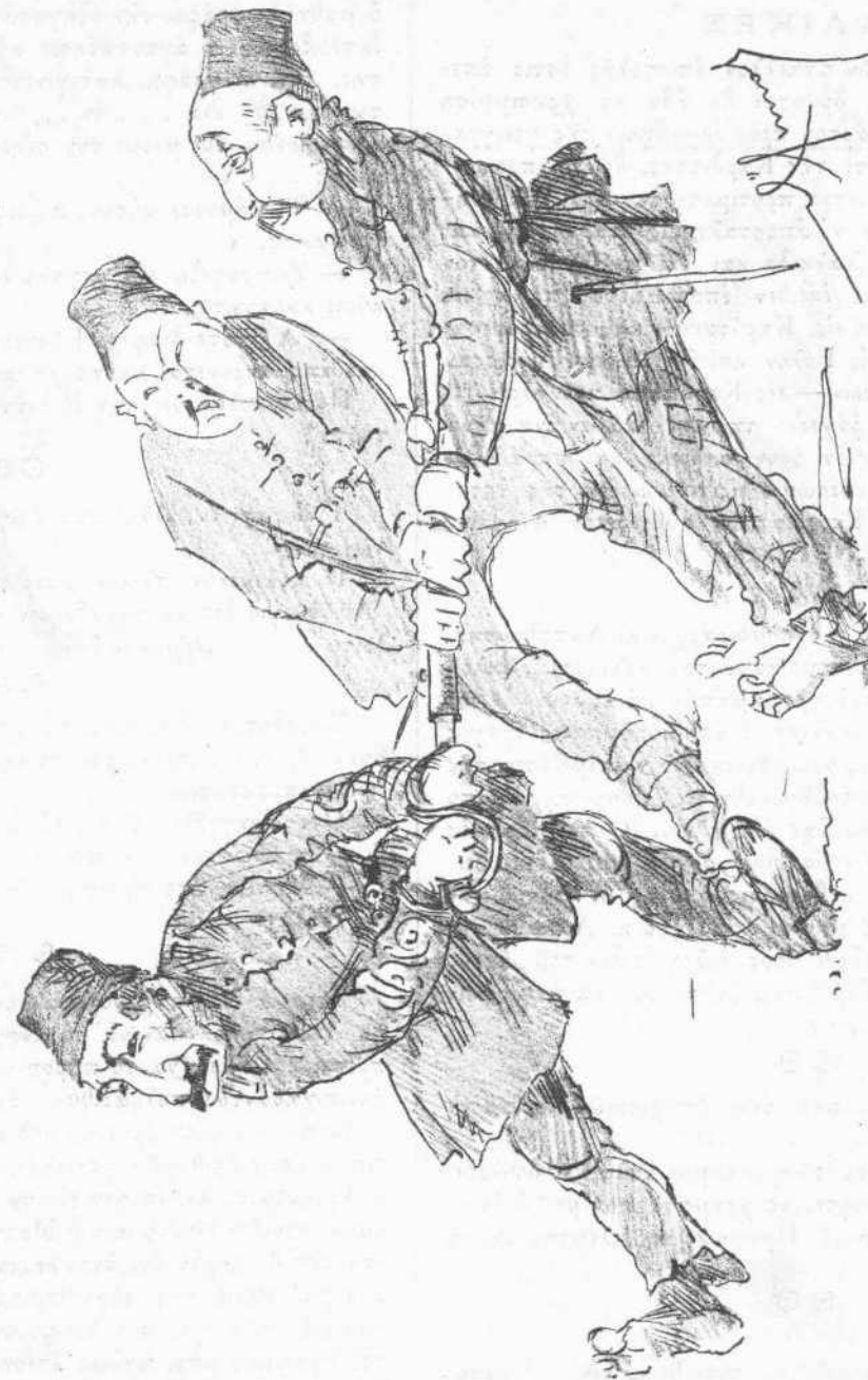
ΠΑΡΑ ΤΑ ΣΥΝΟΡΑ

Ἄχοῦς ἐκεῖ τί συμφορὰ! νὰ τοὺς φωνάζ' ἡ Νίκη, Καὶ τὸ σπαθὶ νὰ μὴ μποροῦν νὰ σύρουν ἀπ' τὴ θήκη!