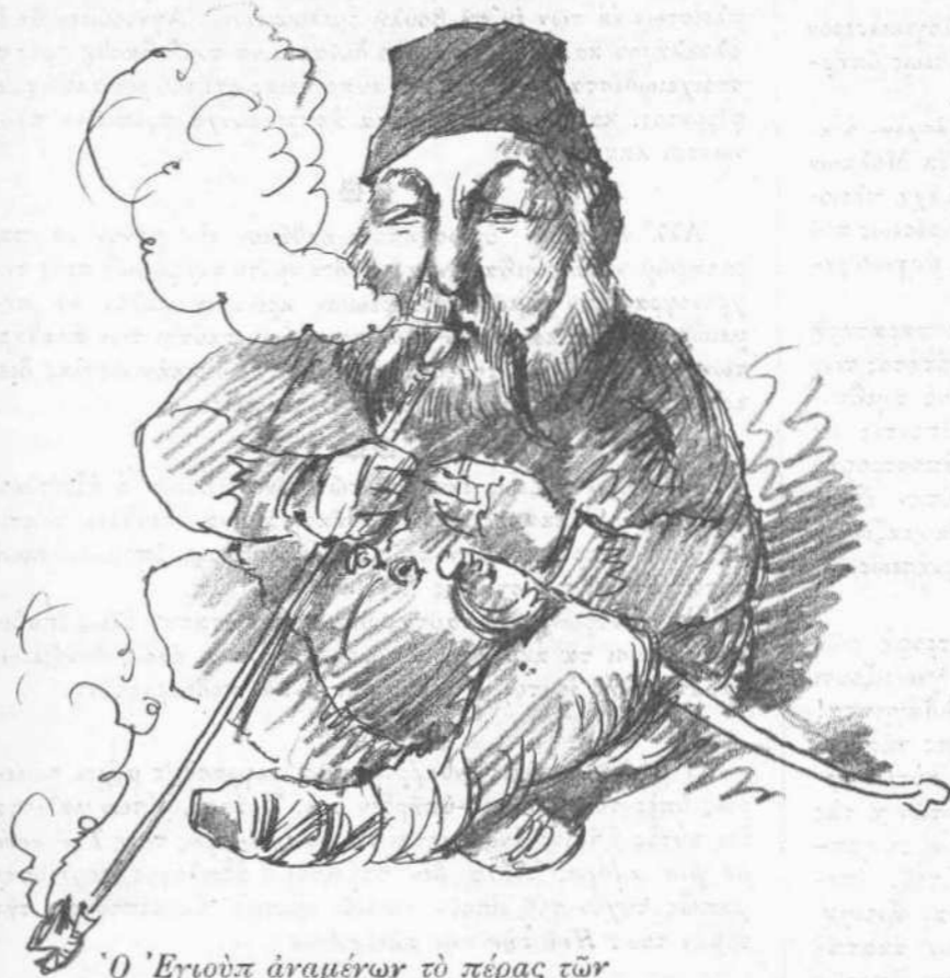
Ὁ Ἐριούπ ἀγαμέων τὸ πέρας τῶν ἐν τῇ Βουλῇ συζητήσεων.