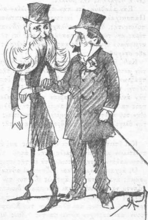
Ὅρατοὶ ἐν τοιαύτῃ στάσει τὴν Τρίτην ὧραν 3 μ. μ. ἐν τῇ ὁδῷ Σταδίου.