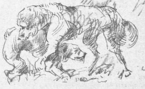
Κυνική φιλοσοφία — Τί εἶνε ὁ ἄνθρωπος! γὰ πίνονται διὰ μίαν φῶλαν!...