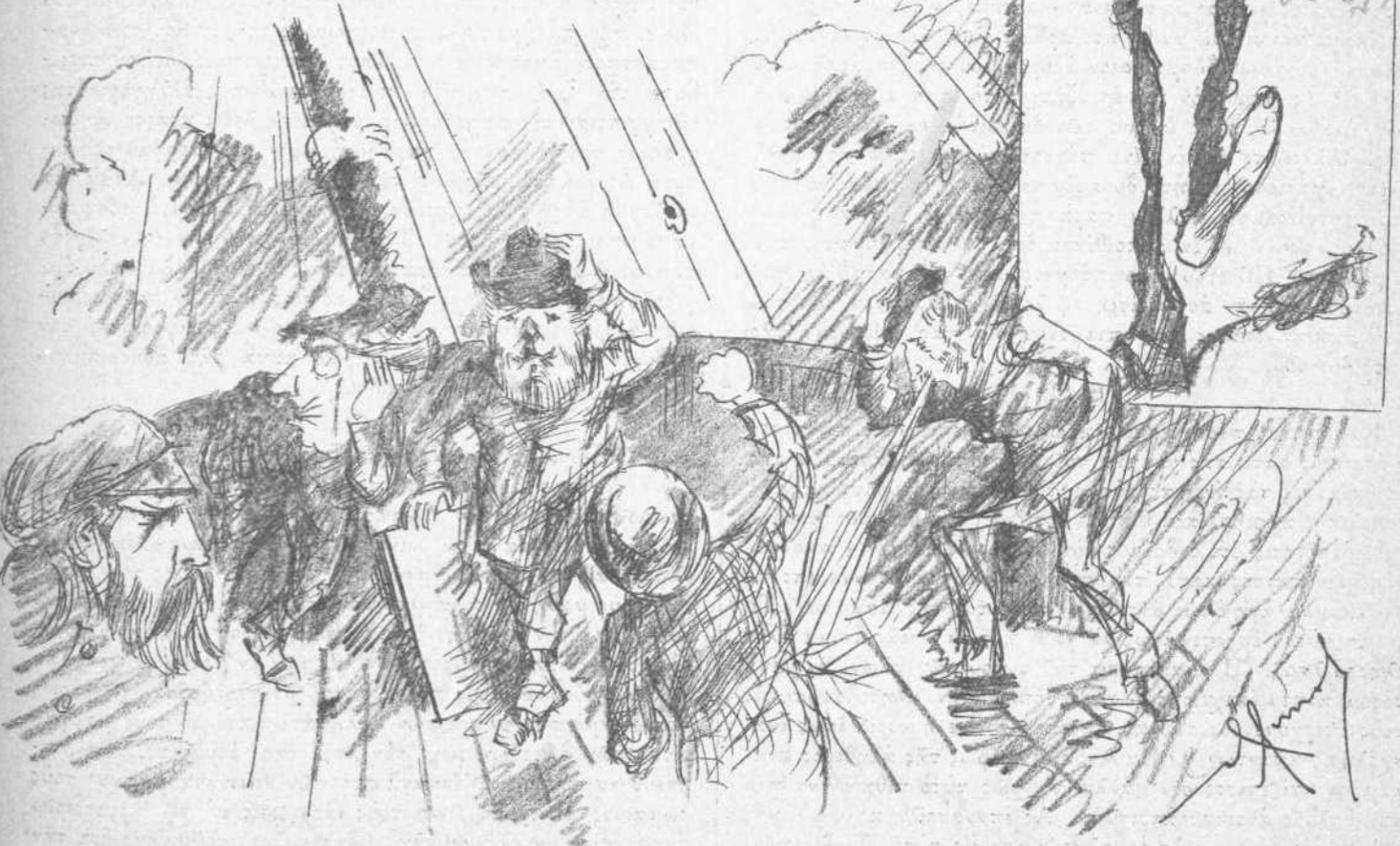
Ἡ ἀναχώρησις τῶν πρέσβων