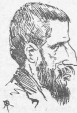
ΚΑΠΕΤΑΝΟΣ Ο ΠΡΟΦΗΤΗΣ

Τὰ σημεῖα τῶν καιρῶν ἐξακολουθοῦσιν ἀθρόως φαινόμενα. Ὡς χρονολογοῦν ἀπὸ ἀνεγράψαμεν καὶ ἐσχολιάσαμεν τὴν