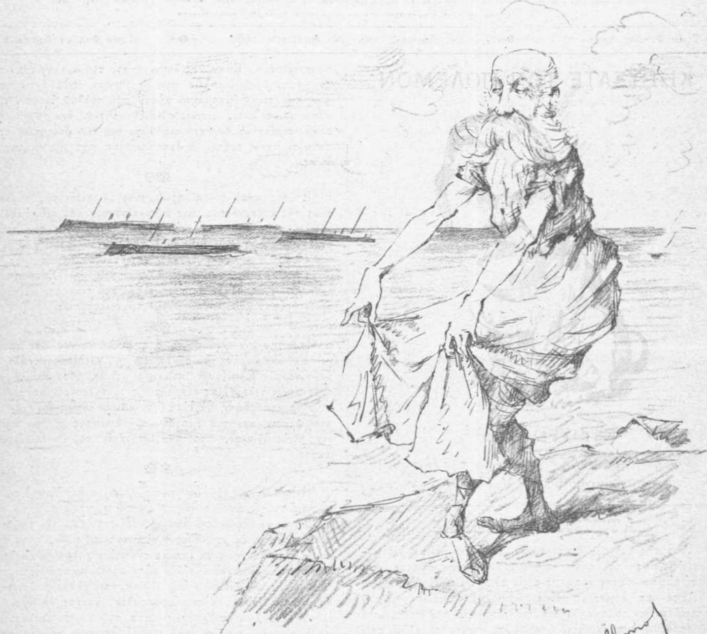
Ἡ ἀνδρική ὑποχώρησις.