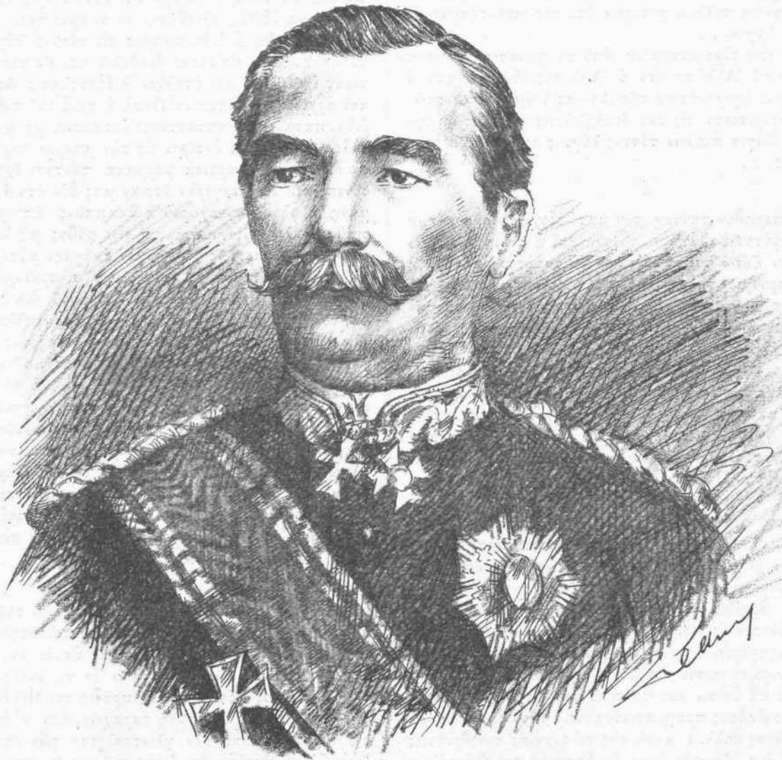
Ο ΥΠΟΣΤΡΑΤΗΓΟΣ ΔΗΜΗΤΡΙΟΣ ΓΡΙΒΑΣ