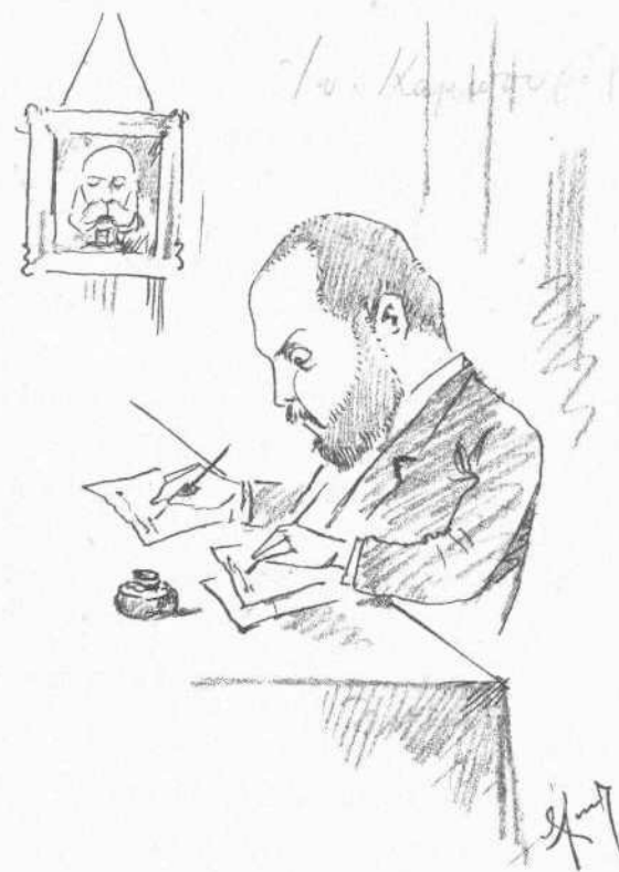
Σύνταξις τῆς «Νέας» καὶ τῆς «Μικρᾶς»