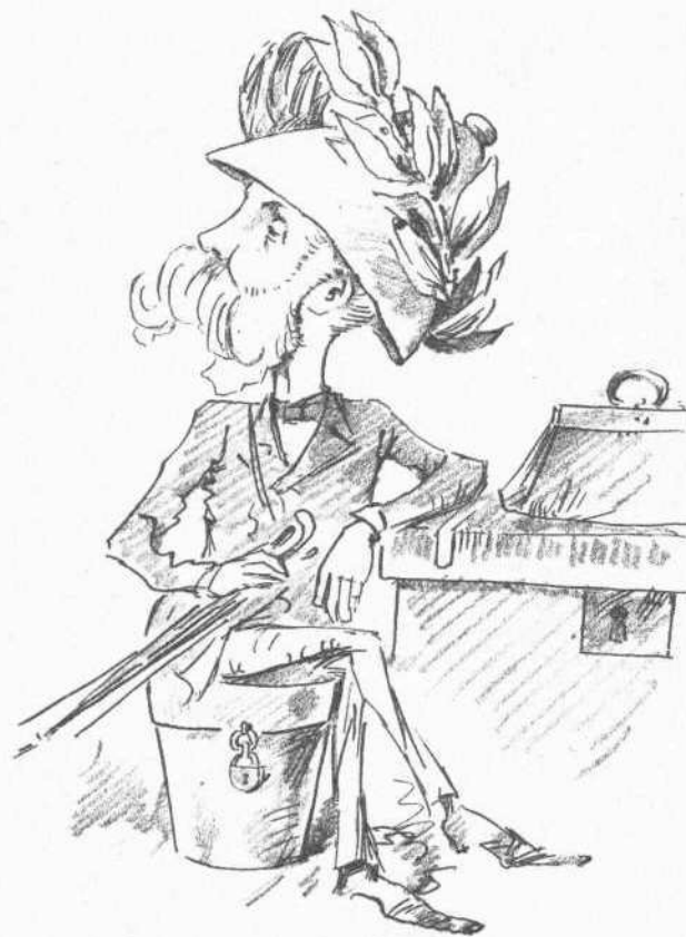
Ἐτοιμος διὰ ταξίδιον εἰς Εὐρώπην πρὸς ἐπίδειξιν τῶν θαφνῶν του.