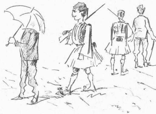
Ἄνὰ εἰς εὐζωνος εἰς ἕκαστον χαρτοπαίκτην.