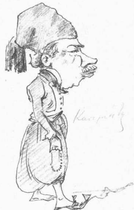
Εἰς Κρανίθειον (μεταμφιεσμὸς χάριν τῆς νέας ἐκλογικῆς περιφερείας)