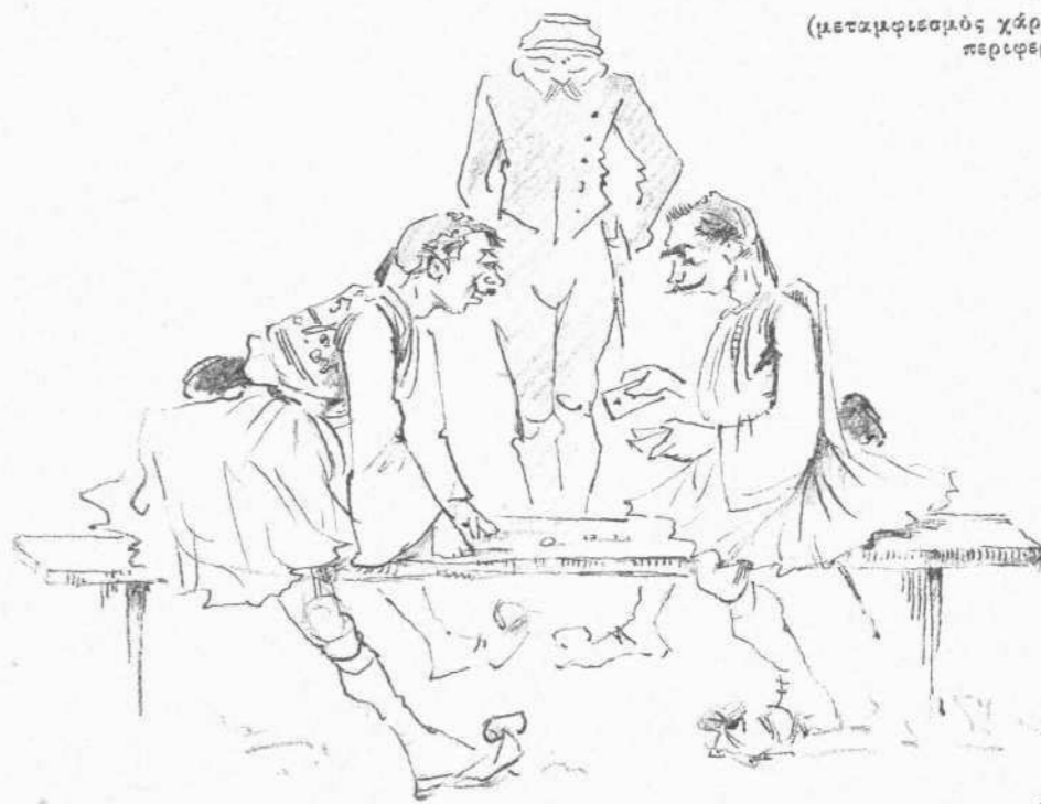
Ἄχρον ἄωτον χαρτοπαιξίας.