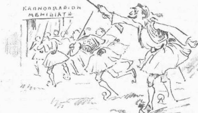
Κατὰ τοῦ ἀσφραγίστου σιγαροχάρτου.