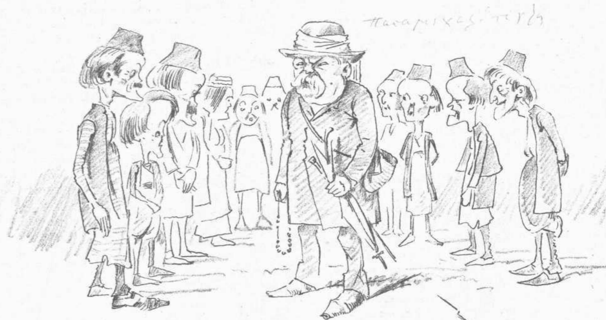
Ἀνά τὴν Ἡπειρον (Ἐπίσκεψις εἰς Κόπραϊναν)

Ὁ κ. Μοῦ ἐνουμφεῦθη τῷ 1863 μετὰ τῆσ δεσποινίδοσ Ἀμέτ, ἐγγόνησ τοῦ στρατάρχου Junot καὶ τῆσ δουκίνοσ Ἀβραντέσ, ἀνεψιάσ τοῦ πρίγκιποσ Στεφανόπολι Κομνηνοῦ. Ἡ κυρία Μοῦ, ἣν δὲν ἠτύχησαν νὰ γνωρίσωσιν αἱ Ἀθῆναι καὶ ἐκ πατρός ἀνήκει εἰς εὐκλεῆσ οἰκογένειαν, οὕσα ἀνεψία τοῦ ναυάρχου Ἀμέτ, ἐνὸσ τῶν ἐνδοξωτέρων ὀνομάτων τοῦ γαλλικοῦ ναυτικοῦ, μεγάλωσ δὲ φημισθέντοσ κατὰ τὴν πολιορκίαν τῶν Παρισίων.