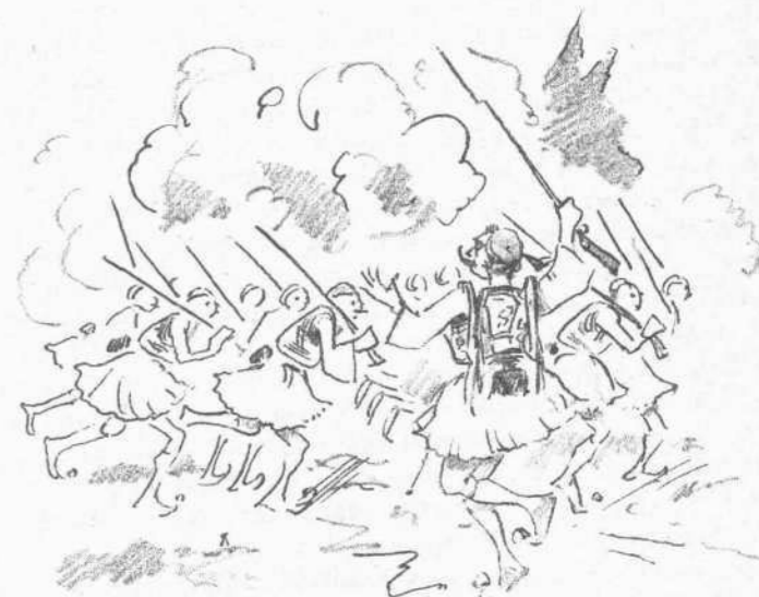
Περὶ ὄνου σικᾶσ