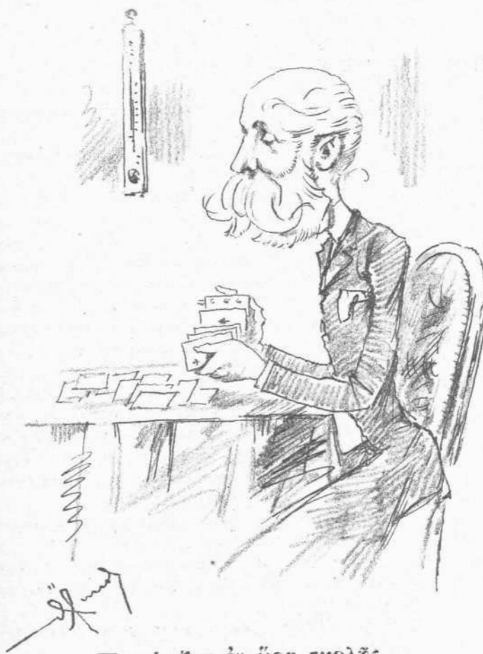
Πασιέντζασ ἐν ὥρᾳ σχολῆσ.