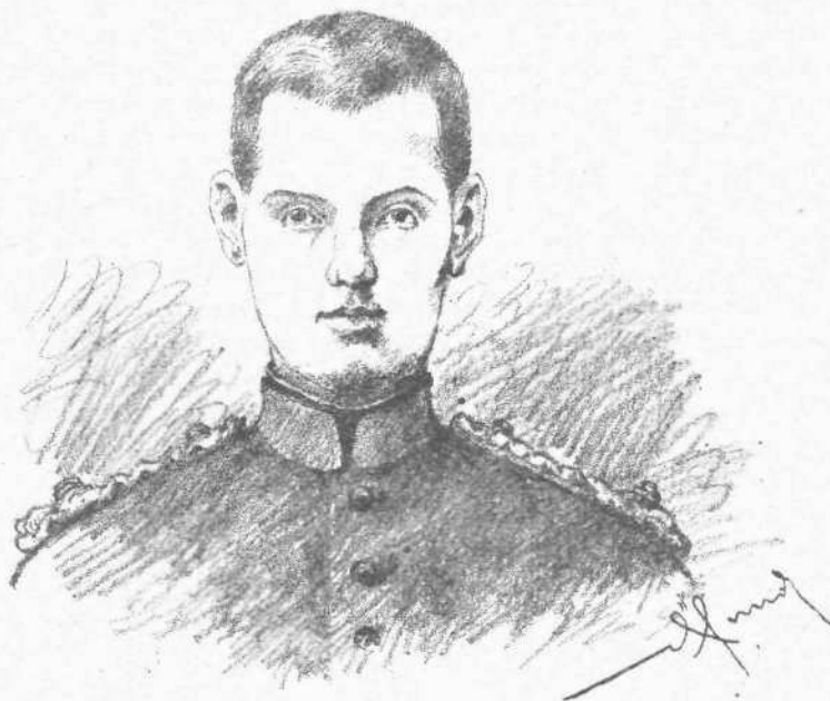
Ο ΔΙΑΔΟΧΟΣ ΚΩΝΣΤΑΝΤΙΝΟΣ

Οὐδέποτε, κατὰ τὴν τελευταίαν εἰκοσαετίαν ἡ Ἑλλὰς συνεκλονίσθη ὑπὸ ἐνθουσιασμοῦ ζωηροτέρου, μᾶλλον ἀυθορμήτου καὶ ἀδολωτέρου ἐκείνου ὅστις ἐξεδηλώθη τὴν ἡμέραν τῆς γεννήσεως τοῦ διαδόχου. Δέκα ὀκτὼ ἔτη συμπληροῦνται ἀπὸ τῆς ἡμέρας ταύτης αὔριον καὶ τὸ βασιλικὸν νήπιον ὅπερ μετὰ συγκινήσεως ἀρρήτου ἐχαίρεισεν ὀλόκληρον τὸ ἔθνος, γενόμενον νεανίας τέλειος, καθίσταται κατὰ νόμον αὐτεξούσιος. Ἡ ἐνηλικιότης τοῦ διαδόχου δὲν θὰ πανηγυρισθῆ ἐπίσημως, τοῦλάχιστον πρὸς τὸ παρόν, διὰ δοξολογιῶν, δεήσεων, δημοσίων πανδακισιῶν, φωταψιῶν, ὡς ἐπανηγυρίσθη ἡ γέννησις αὐτοῦ. Ἄλλ' ἐν πάσῃ ἑλληνικῇ καρδίᾳ θὰ ἀναζωογονηθῶσιν αὔριον ζωηρότεροι αἱ γλυκεῖαι ἐλπίδες, ὑπ' ὧν ἐνεφοροῦντο αἱ καρδίαι τῶν παραστάντων κατὰ τὴν ἐν τῷ κόσμῳ ἔλευσιν τοῦ περιποήτου ἐθνικοῦ Μεσσίου. Πρὸς τὴν χρυσαίζουσαν ἡῶ, ἥτις ἐρόδισε τὸν ἐθνικὸν ὀρίζοντα κατὰ τὴν 21 Ἰουλίου τοῦ 1868, τὴν 21 Ἰουλίου τοῦ 1886 προσβλέπουσι μετὰ νέων προσδοκιῶν καὶ πόθων μυχιαιτάτων ἐλευθεροὶ καὶ δοῦλοι Ἕλληνας. Εὐτυχῶς ἡ πρόσφατος ἐξεταστικὴ δοκιμασία τοῦ Διαδόχου ἀπέδειξεν ὅτι οὗτος ἔχει πλήρη συναίσθησιν τῶν ἐπιβαλλομένων αὐτῷ καθηκόντων. Ὡς ἐλέχθη δι' ἐ-