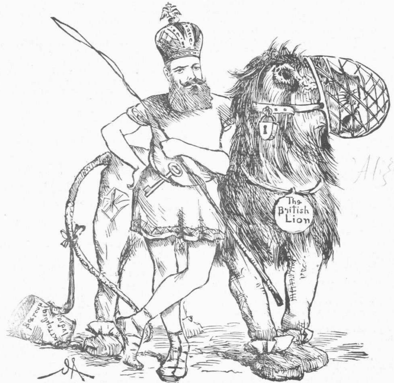
«Ο δαμαστής τοῦ λέοντος.»