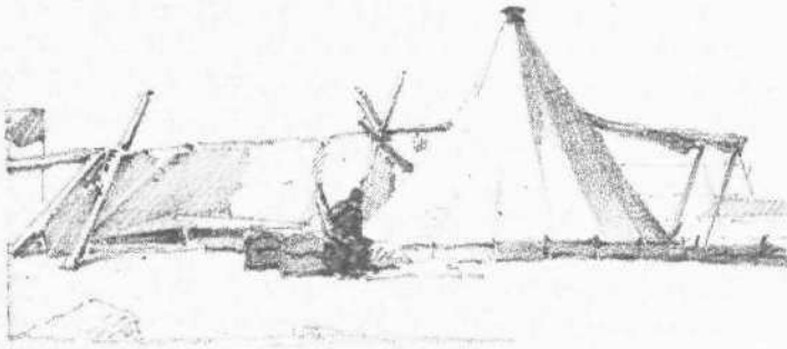
Τελωνεζιον εν Αγ. Κυριακῃ (ἐπινείω τῶν Φιλιατρῶν)