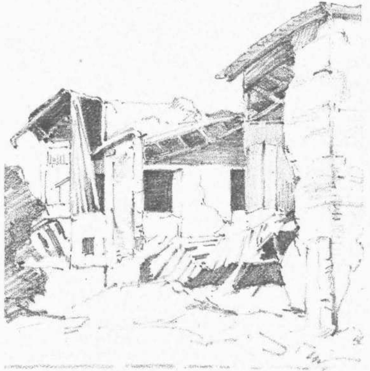
Οἶκία εν Φιλιατροῖς