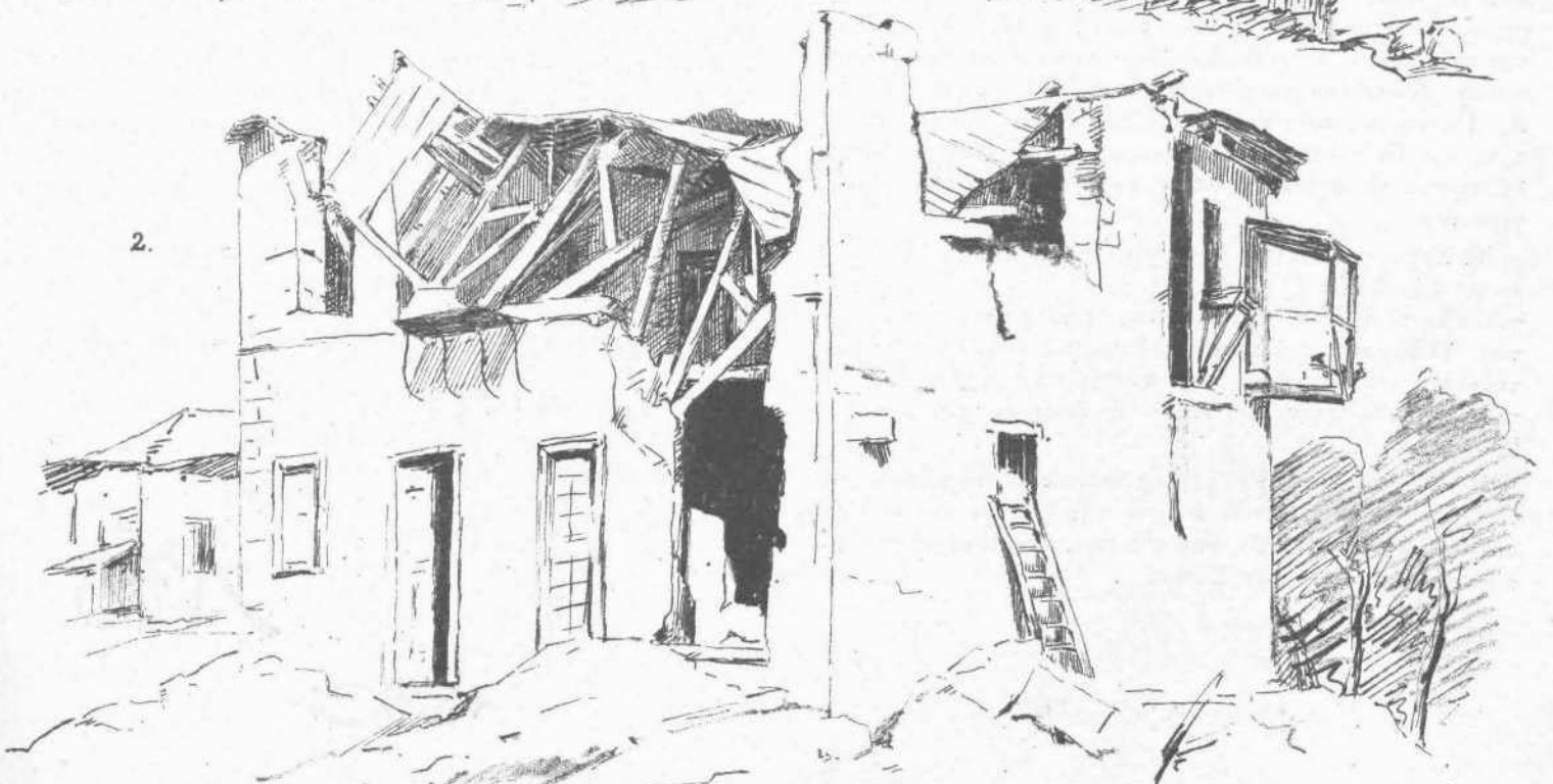
1. Οἰκία Ἀντωνίας Κραϊκούκνας ἐν Μαραθουπόλει. 2. Οἰκία Β. Πούλου ἐν Φιλιπποπόλει.