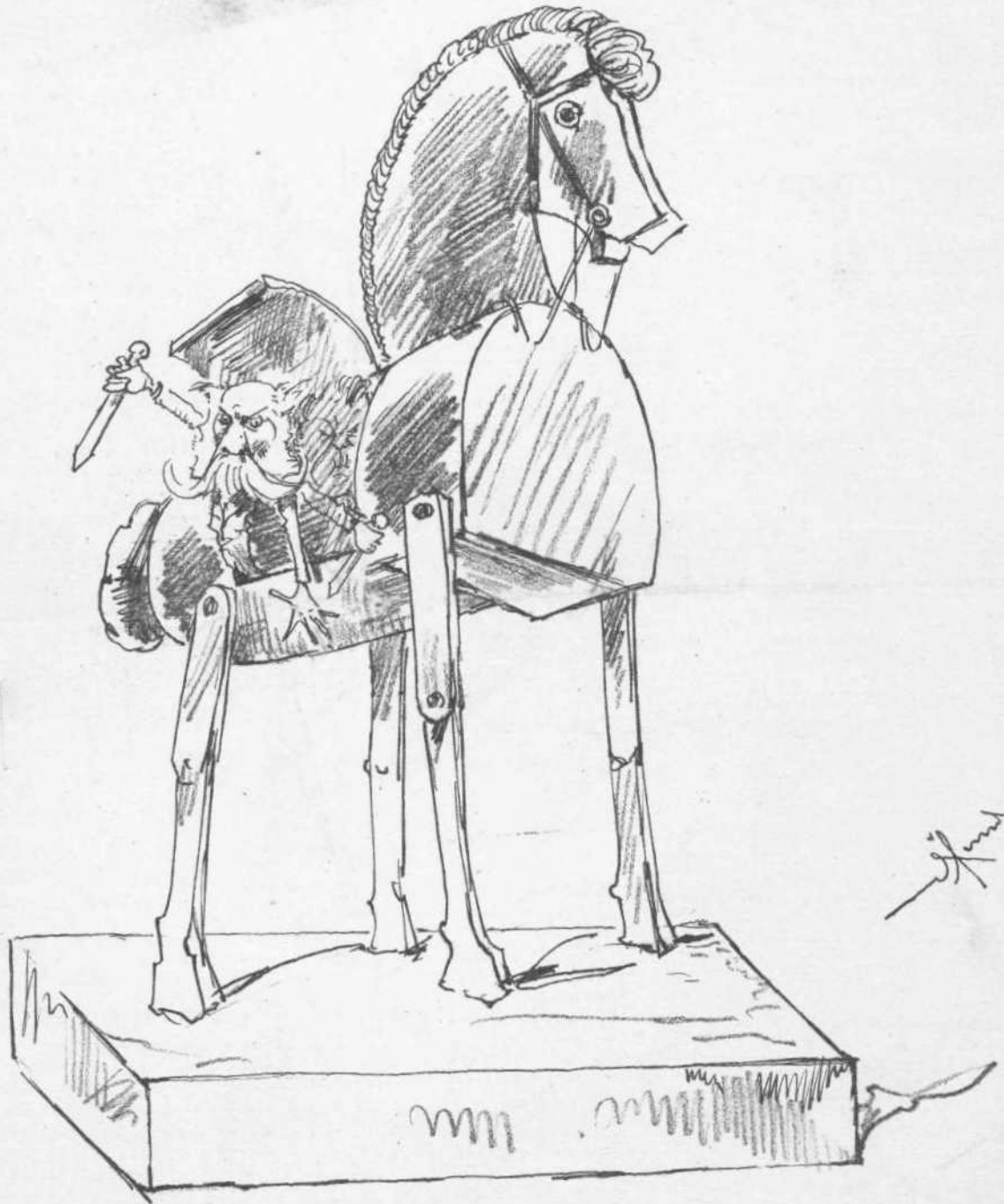
Ο ΘΕΟΔΟΥΡΕΙΟΣ ΙΠΠΟΣ Προς Έλωσην της Έφεσου.