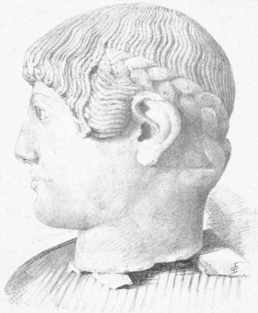
ΚΕΦΑΛΗ ΕΥΡΕΘΕΙΣΑ ΕΝ ΑΚΡΟΠΟΛΕΙ

Ἡ κεφαλὴ αὕτη εὐρεθεῖσα κατὰ τὰς ἐν τῇ Ἀκροπόλει γινομένης ἀνασκαφῆς φαίνεται ἔργον καλλιστῆς τέχνης. Ἐπὶ ταύτης εἰσέτι οἱ ἀρμόδιοι δὲν ἐξήνεγκον τὰς ἐπιστημονικὰς αὐτῶν κρίσεις οὔτε ἐγένοντο αἱ ἀρμόζουσαι μελέται· ἔνεκα τούτου καὶ ἡμεῖς ἀπέχομεν νὰ δώσωμεν πληροφορίας ἐπιστημονικὰς εἰς τοὺς ἀναγνώστας ἡμῶν, ἀλλ' ἔνεκα τούτου δὲν ἐθεωρήσαμεν καὶ ἄσκοπον τὴν δημοσίευσιν τῆς ἀνωτέρως εἰκόνας.