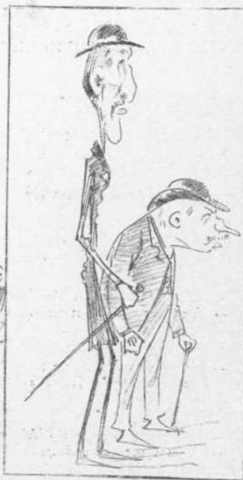
ΟΙ ΣΠΟΥΔΑΙΟΤΕΡΟΙ ΚΟΜΜΑΤΑΡΧΑΙ ΤΟΥ ΥΠΟΥΡΓΕΙΟΥ ΤΟΥ ΛΑΟΥ