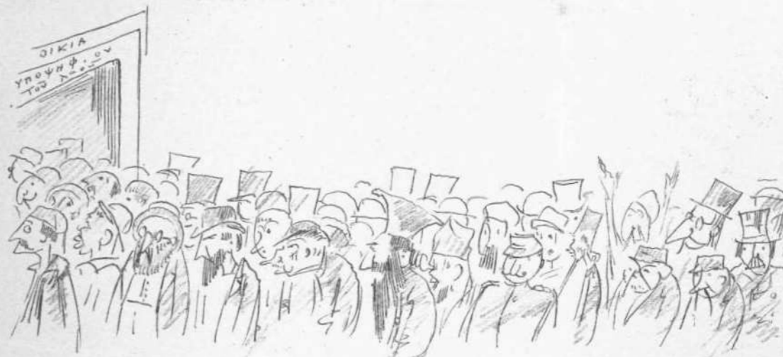
ΑΙ ΔΙΑΦΟΡΟΙ ΚΟΙΝΩΝΙΚΑΙ ΤΑΞΕΙΣ