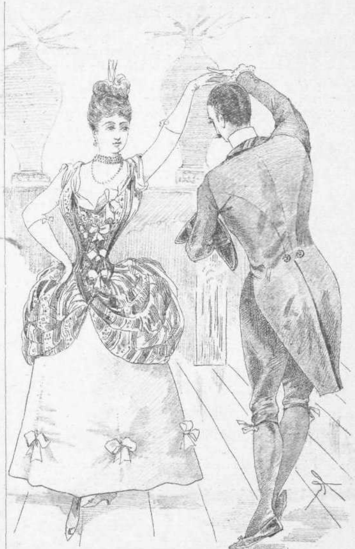
Παραθέτομεν ἐνταῦθα τὴν εἰκόνα τῆς στολῆς ταύτης, ἣν παραλαμβάνομεν ἐκ τῆς Revue Illustrée.

Νέα ἐνδυμασία κομψή, ἁμα καὶ χαρίεσσα, θέλει ἀντικαταστήσει ἤδη θετικῶς τὴν πένθιμον στολήν, ἣτις δίδει εἰς τὰς σημερινὰς ἐσπερίδας εἰς τοὺς ἀνδρας ἀπαισίαν τινὰ ὕψιν πενθούντων ἐν ἀντιθέσει πρὸς τὴν ἀπαστρέπτουσαν καὶ ποικιλόχρουν περιβολὴν τῶν γυναικῶν. Ὁ νέος οὗτος συρμὸς ἀπαρτίζεται ὑπὸ φράκου μεταξωτοῦ χρώματος γλυκέος, ὑπὸ κοντοῦ πανταλονίου μετὰ καλτσῶν, ὑπὸ γιλεκίου πεποικιλμένου διὰ κεντημάτων καὶ ὑποκαμίσου μετὰ τριχάπτου εἰς τὸ στῆθος.