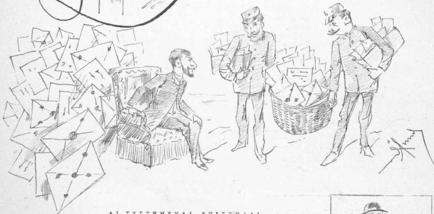
ΑΙ ΕΥΣΤΗΜΕΝΑΙ ΕΠΙΣΤΟΛΑΙ