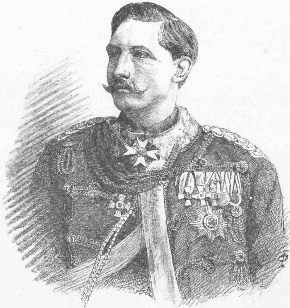
Ο ΔΙΑΔΟΧΟΣ ΤΗΣ ΓΕΡΜΑΝΙΑΣ ΓΟΥΛΙΕΛΜΟΣ