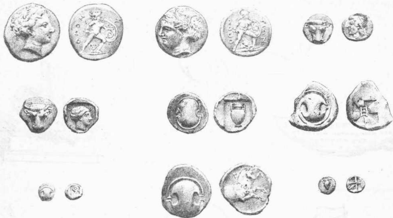
Ἐκ τῶν κλαπίντων νομισμάτων τοῦ Μουσείου