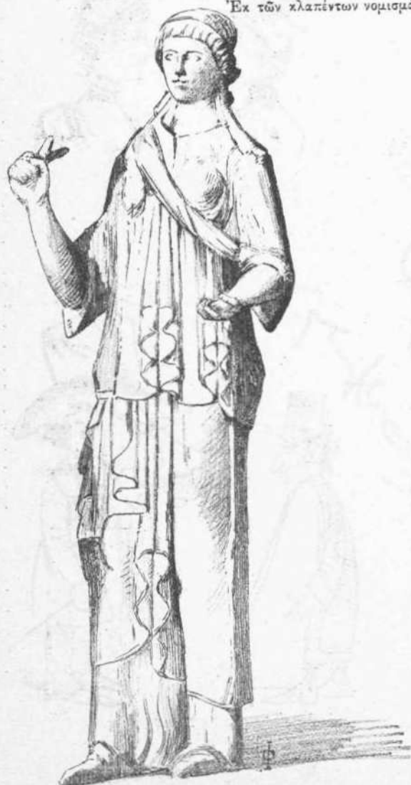
Τὸ κατασχεθὲν χαλκοῦν ἀγαλμάτιον ἐν Πειραιεῖ