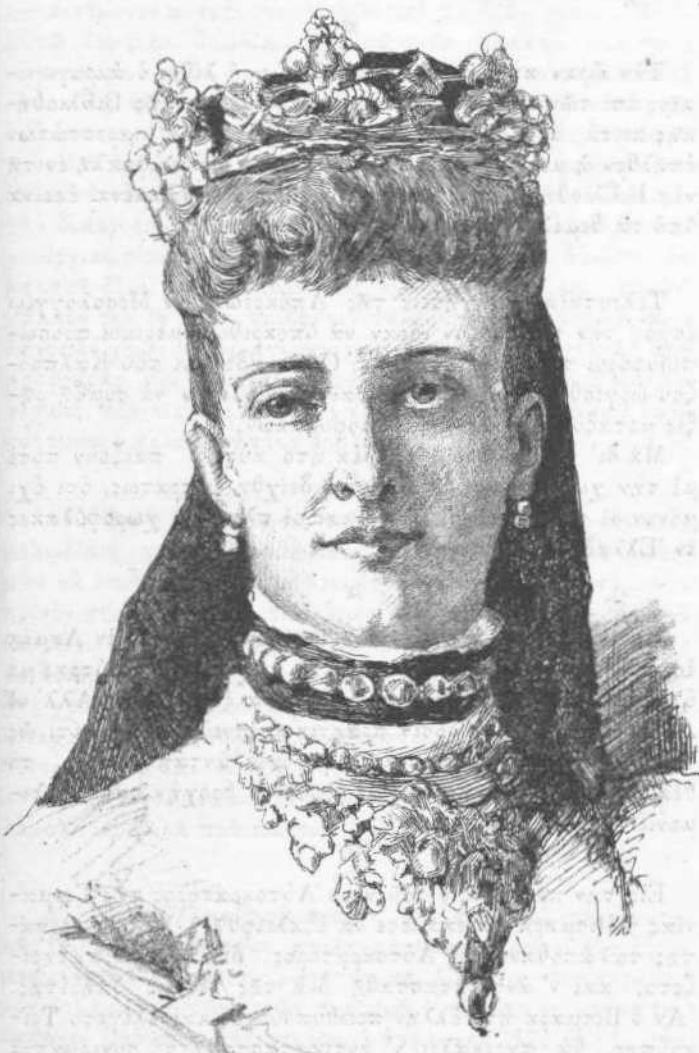
Ἡ ΠΡΙΓΚΙΠΗΣΣΑ ΤΗΣ ΟΥΑΛΙΑΣ