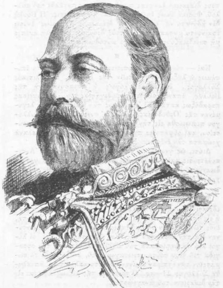
Ο ΠΡΙΓΚΗΨ ΤΗΣ ΟΥΑΛΙΑΣ