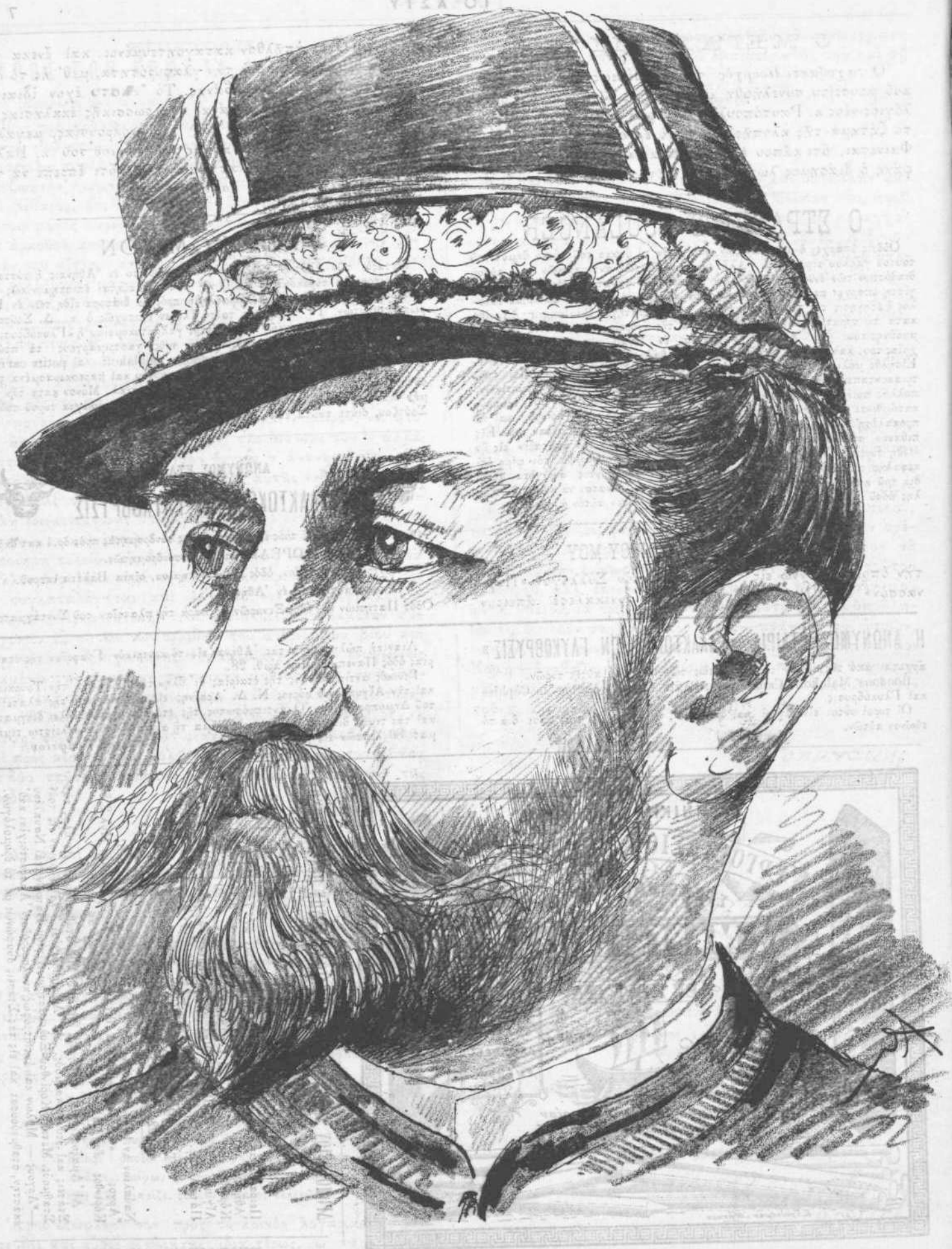
Ο ΣΤΡΑΤΗΓΟΣ ΒΟΥΛΑΝΖΕ