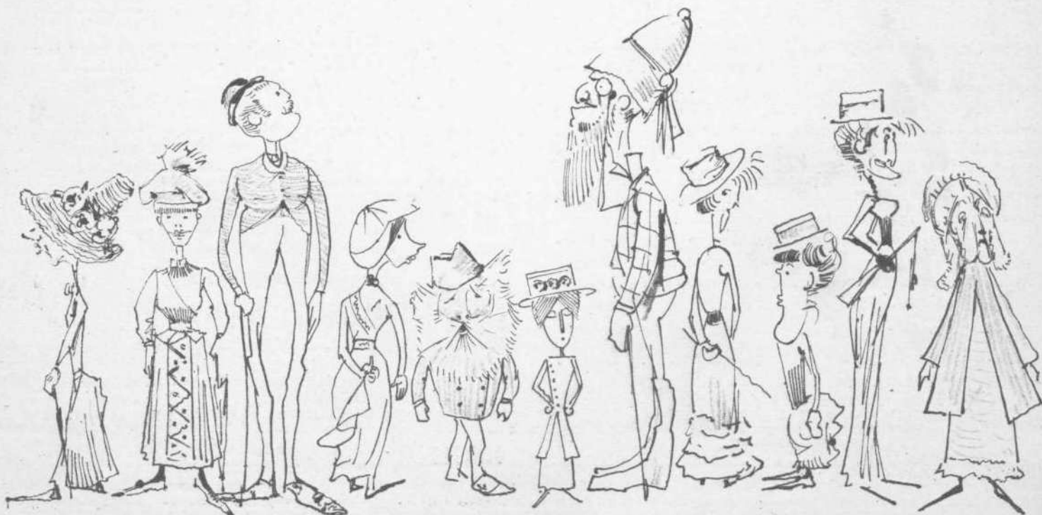
Ξένοι ἐν Ἀθήναις