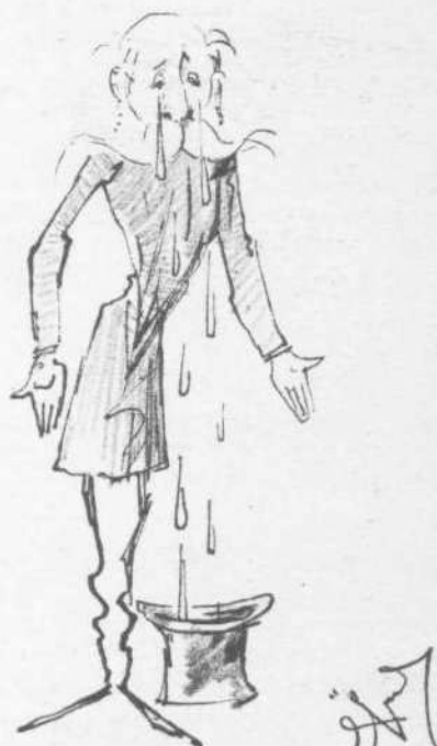
Δίκη τὸ χυθὲν αἷμα