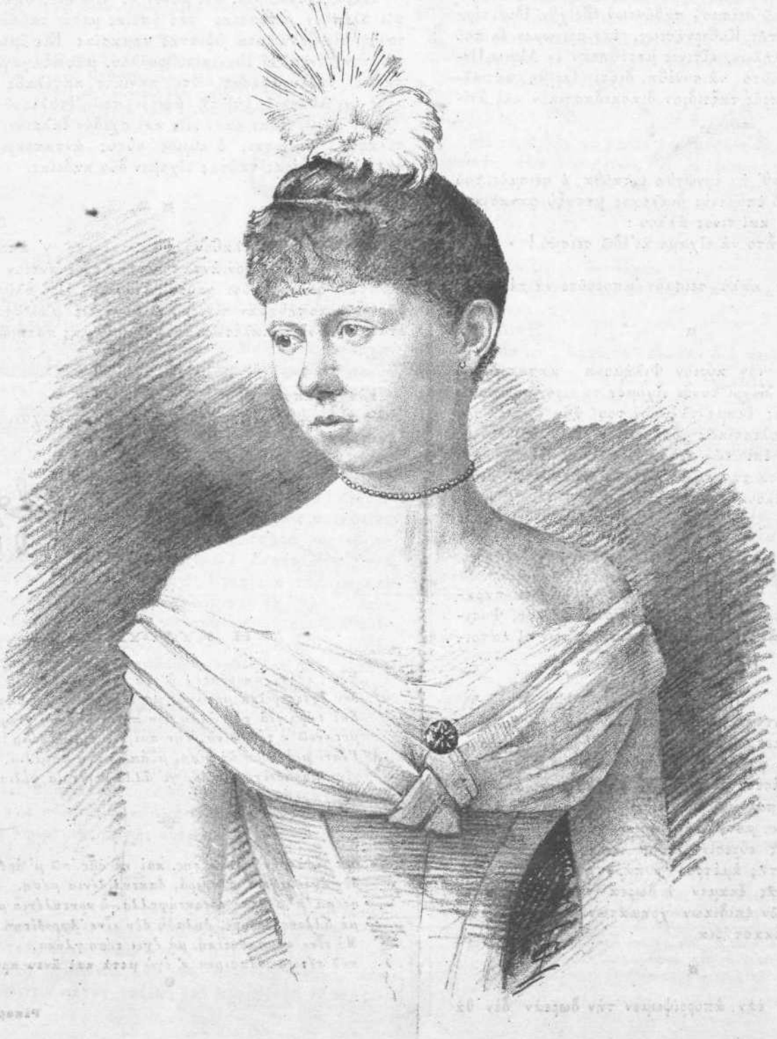
Ἡ ΜΝΗΣΤΗ ΤΟΥ ΔΙΑΔΟΧΟΥ ΠΡΙΓΚΗΠΙΣΣΑ ΣΟΦΙΑ