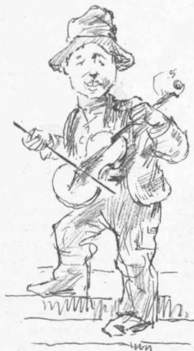
Νά φορολογηθῆ πρός ἱκανοποίησιν τῶν ἐν Μασσαβὰ Ἑλλήνων