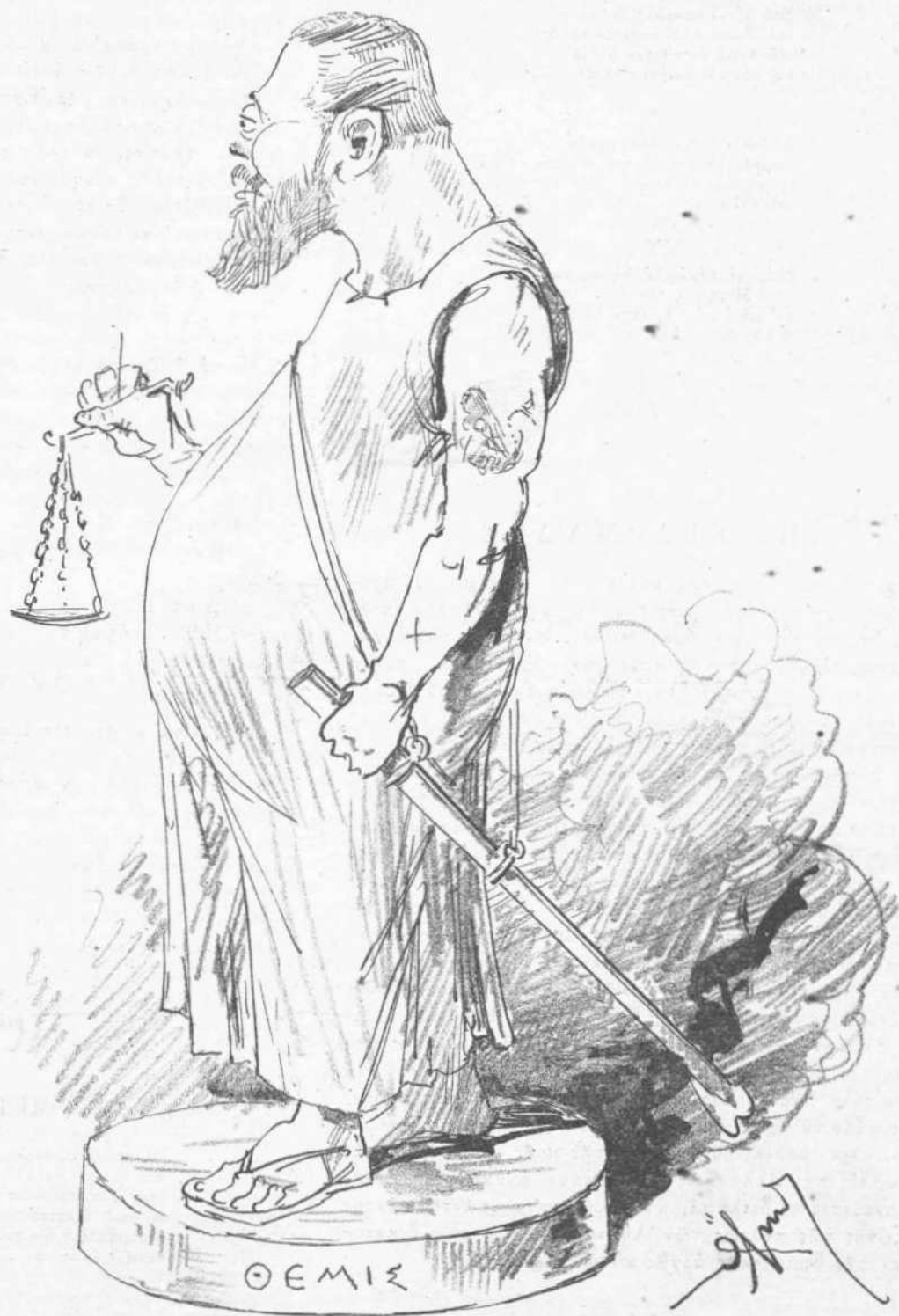
ΔΙΑ ΤΗΝ ΕΚΘΕΣΙΝ