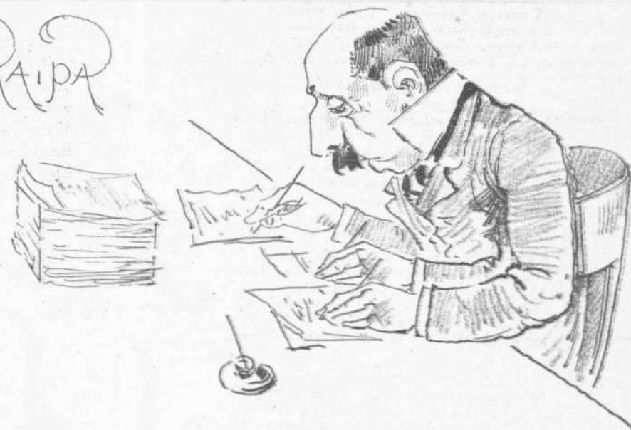
Και Τριχίρης διά να υπογράψη τὰ ἔγγραφα τῶν τριῶν Ὑπουργείων.