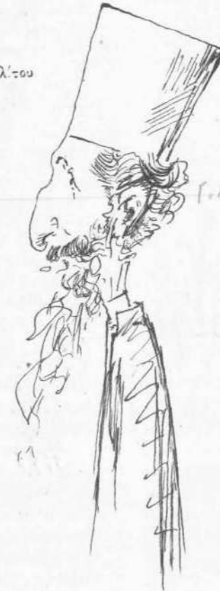
Ἐν περιπτώσει ἀποτυχίας.