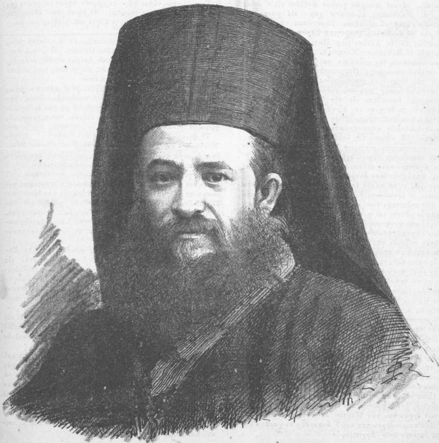
Ο ΑΡΧΙΕΠΙΣΚΟΠΟΣ ΚΕΦΑΛΛΗΝΙΑΣ ΓΕΡΜΑΝΟΣ