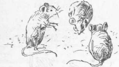
Οἱ λαποῦδάται τῶν ὑπνόμων.