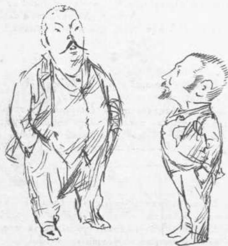
— Τί φρονεῖς περὶ τοῦ θυμεναίου τοῦ Μπέλου; — Se non è bello, è ben trovato.