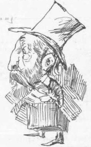
Ἀγαθοεργία διὰ κλωθῶν.