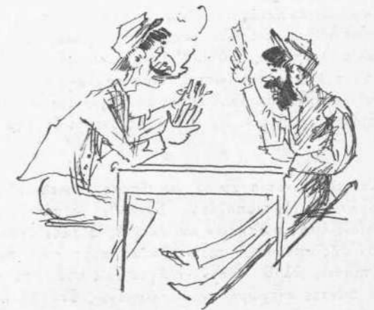
Χαρτοπαίξιμα μὴ προβλεπομένη ἀπὸ τὴν ἀστυνομικὴν διάταξιν.