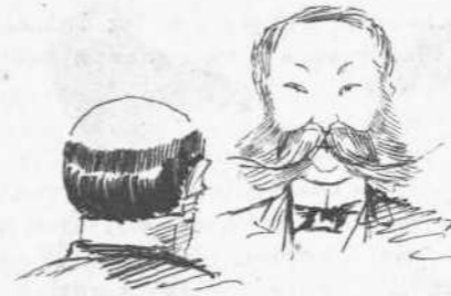
Παραστάσεις πρέσβειος διὰ τὴν ὑποστήριξιν μητροπολῆτος γερμανοῦ.