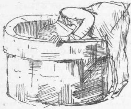
Διὰ τὰ ἰδῆ ποῦ θὰ φθάσουν τὰ Λαύρια.