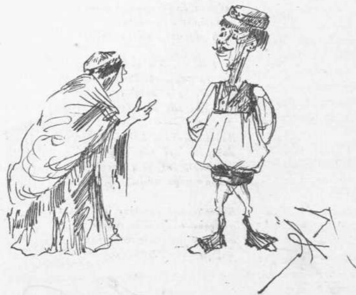
— Θὰ μᾶς χαλάσουν τὸ λαχανόκηπο διὰ παλάτι. — Χωρὶς λάχανα πῶς θὰ κάμουμε πόλεμο! Καὶ αὐτὸ μηχανογραφία!!