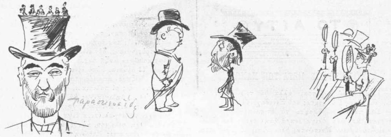
Νάνοι καὶ γίγας.

— Κερδίζουν βλέπεται τὰ ψωμί τους. — Μ' ἓνα ψωμί οἱ νάνοι περνοῦν ὅλη τους τὴ ζωή.