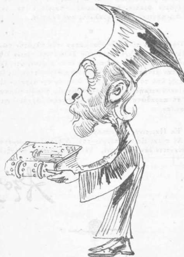
Πρὸς ἀπόκτησιν Μεγαλοσταύρου διὰ τῆς μεθόδου τοῦ Εὐαγγελίου.