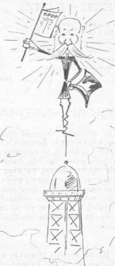
Ἡ Πρωία εἰς τὸν πόρον τοῦ Ἄϊαλ.