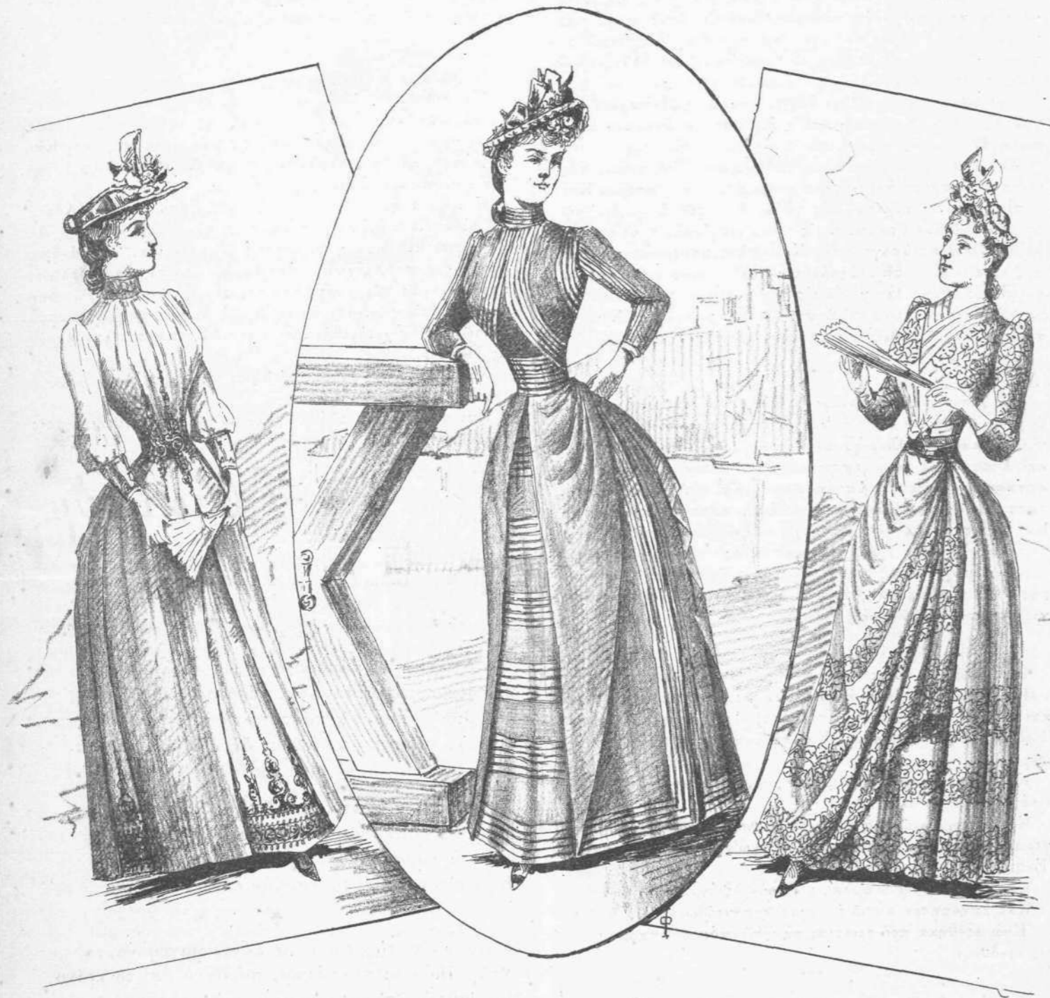
Ἐνδυμασία Παρισινὰ τοῦ τελευταίου στρομοῦ.