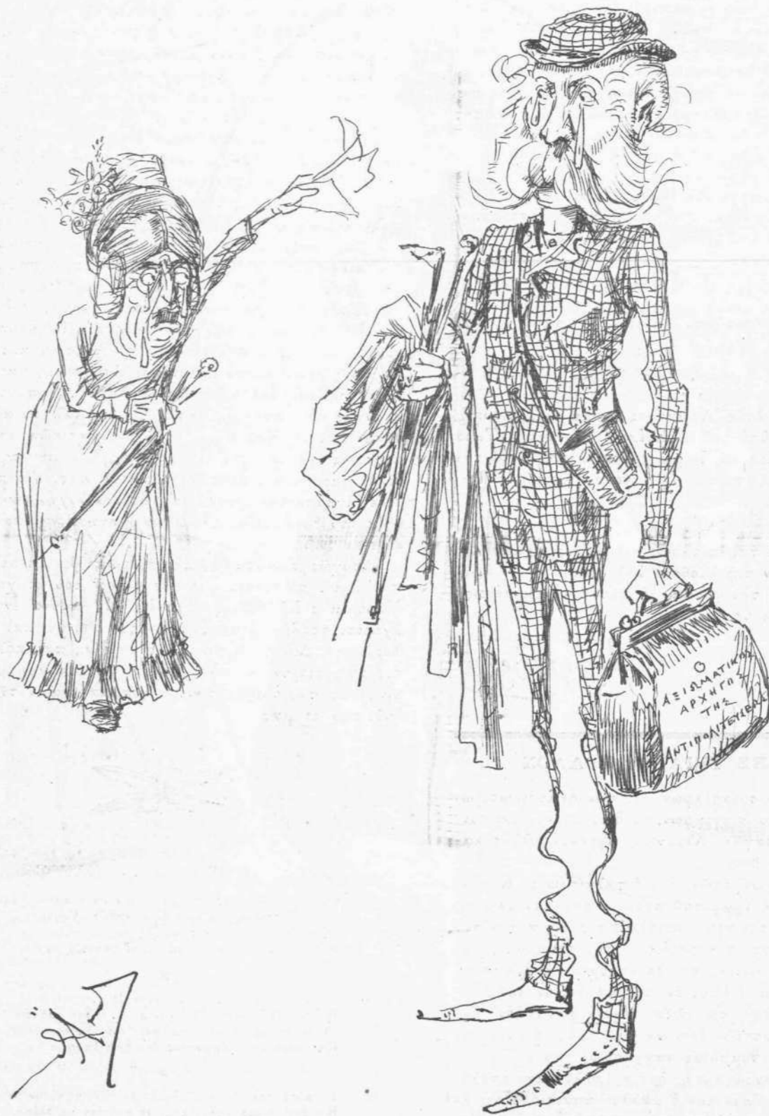
Διὰ ν' ἀκούσῃ ἐκ τοῦ πλησίον τὰς φωνάς.