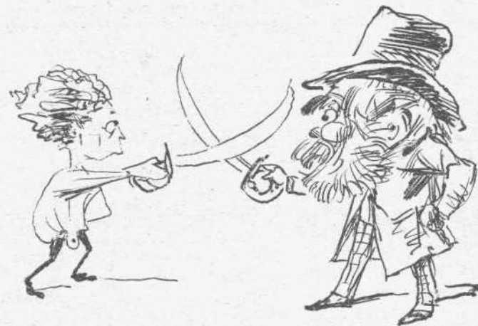
Νέα λύσις διαφοράς μεταξύ διδασκάλου και μαθητού.