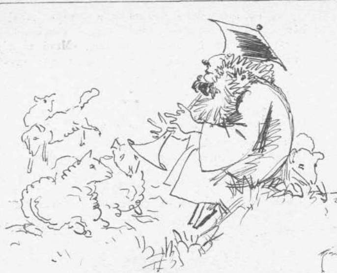
'Ο ποιμήν και τό ποιμνιον εν Κορίνθω μετά την έγκαθίδρυσιν του Μητροπολίτου.