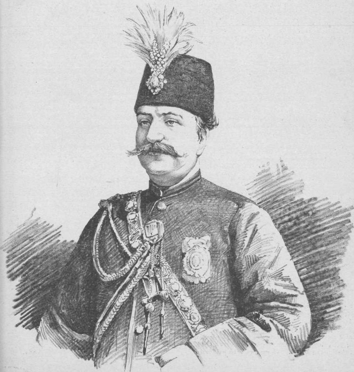
Ο ΣΑΧΗΣ ΤΗΣ ΠΕΡΣΙΑΣ