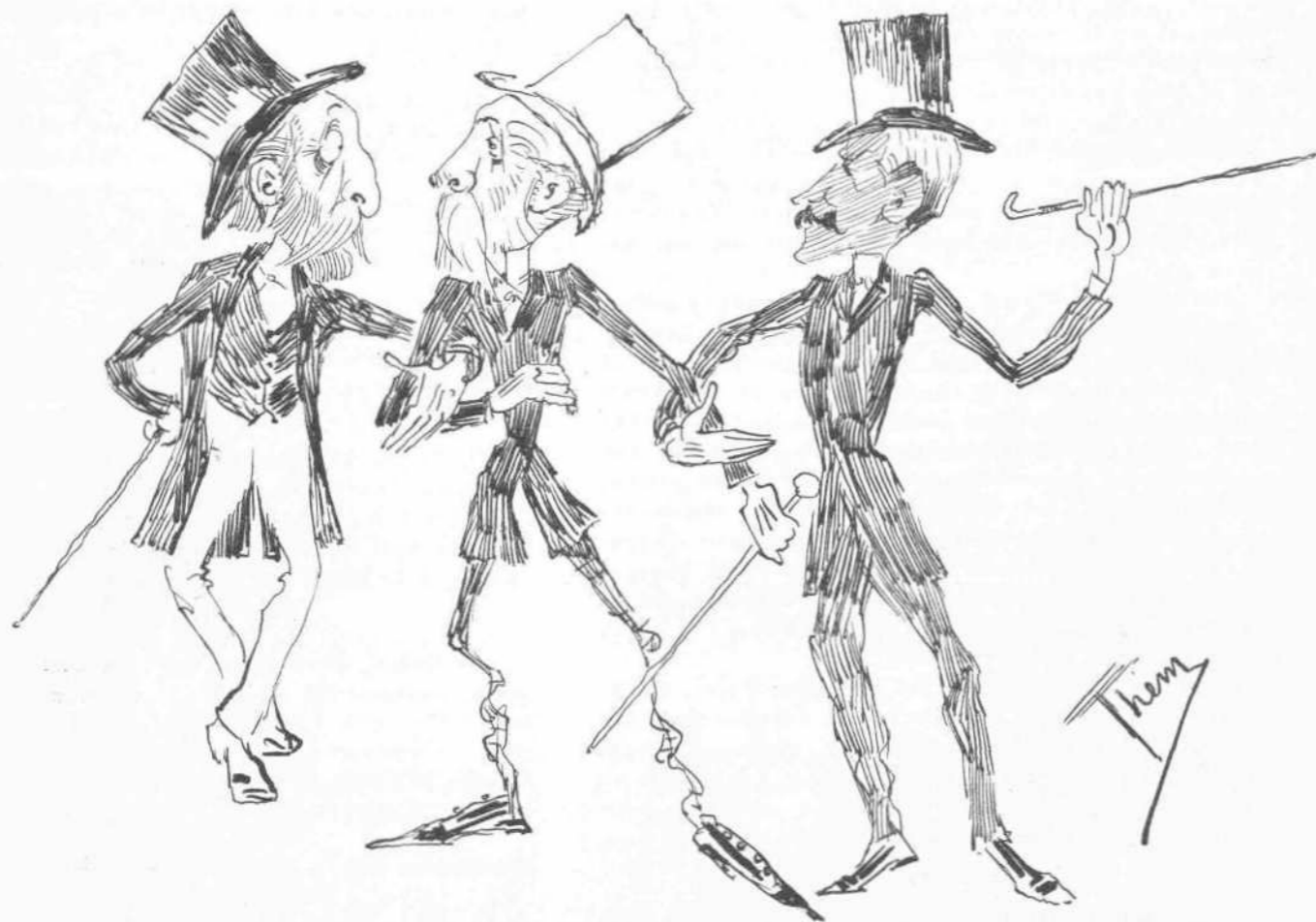
Ἡ τριπλῆ συμμαχία ἐν Παρισίοις. (Ἱστορικόν).