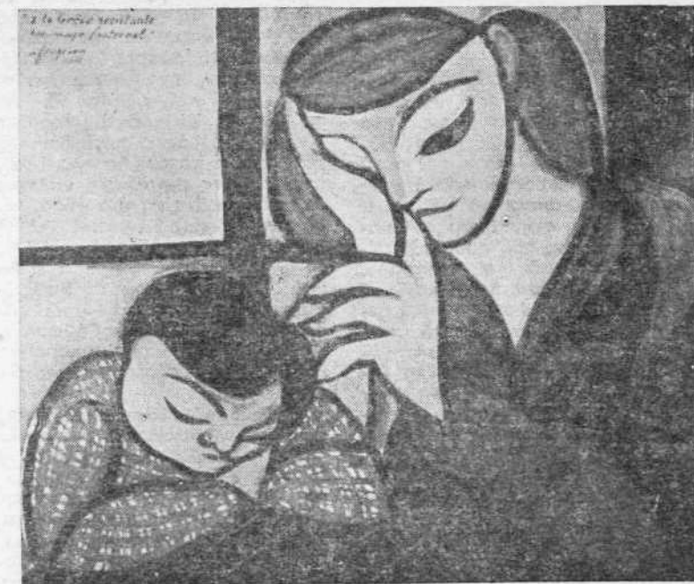
ΦΟΥΖΕΡΟΝ : Ἡ μητέρα καὶ τὸ παιδί

Ἄστον καλὴ κ' ἄστον ψηλὴ κ' ἄστον χρυσὴ τὸν Ἥλιο σου γιὰ νὰ φανοῦν χρυσότερα τὰ ἔξάρτια σου σὲ Αἰγαίο — Μπουμπουλίνα καπετάνισσα Νὰ λύ — πού φαγε φουσκοθαλασσὰ τὴν πρῶμη μας νὰ λύσουμε τὴ γαλανὴ φτερούγα του στὴν ἔσπεριὰ τοῦ χρόνου