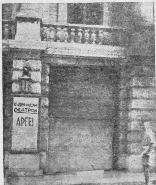
Ἐθνικὸ Θέατρο: «Ἀργεῖ ἐκουσίως» ...

Ἡ προσπάθεια τῶν ἀνθρώπων αὐτῶν πού ξεκίνησαν ἐδῶ κ' ἐνὰ χρόνον με μοναδικὰ τους ἐφόδια τὴν καλλιτεχνικὴ τους ἀξία καὶ πίστη καὶ πού μέσα ἀπὸ τόσα φορολογικὰ ἐμπόδια καὶ τρομοκρατικὸς ἐκδῆασμοὺς κατόρθωσαν ὄχι μόνο νὰ σταθεροποιήσουν τὴν προσπάθειά τους μὰ καὶ νὰ τὴν συνεχίσουν πρὸς τὴν ὀλοκλήρωσή της με δυὸ σήμερα θιάσους στὶς πὺ μεγάλες πόλεις τῆς Ἑλλάδας δειχνει πὺ καθαρά τὸ πόσο μιὰ τίμια δουλειὰ κερδίζει ἀπ' τὴν πρώτῃ στιγμῇ τὸ πλατὺ κοινὸ πού τὴν κατανοεῖ καὶ τὴ δικαίωνει.