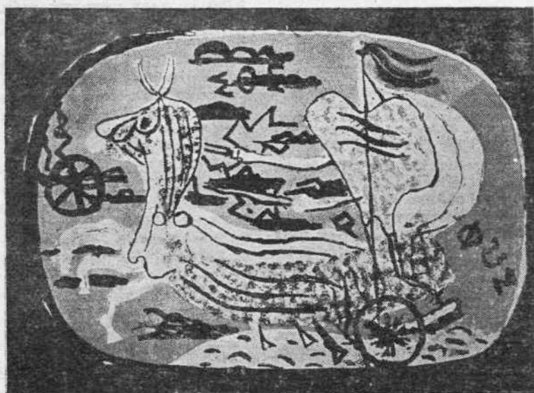
ΜΠΡΑΚ : Ὁ Ἥλιος