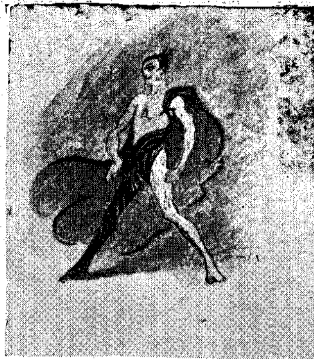
ΠΑΝΟΥ ΑΡΑΒΑΝΤΙΝΟΥ. Αριστερά: σκηνογραφία της όπερας «Γιρέλσα» του Σρέκερ. Έπάνω: κοστούμι από τόν «Δόκτο ρα Φάουστ» του Μπουσόνι. (Βλέπε στη σελ. 9 σχετικό άρθρο του κ. Ήλια Ζιγί)