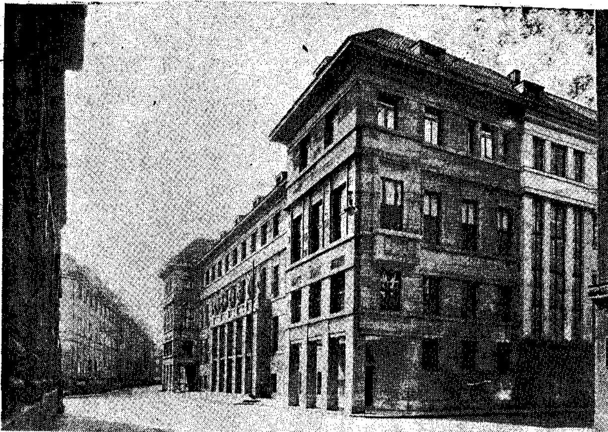
Η ΛΑΤΊΚΗ ΒΙΒΛΙΟΘΗΚΗ ΤΗΣ ΠΡΑΓΑΣ. Είναι ένα από τα σημαντικά κέντρα μελέτης των Τσεχοσλοβάκων. (Βλέπε το τρίτο μέρος της μελέτης του καθηγητή Χ. Θεοδωρίδη στη σελίδα 4).

Μπορεί βέβαια να είναι ένας καθυστατημένος, μπορεί οί παραπάνω αιτίες του άλλοποφάγματος, που τις θεωρώ έγω για κομικές, ν' άπο-