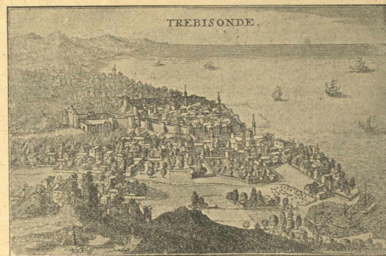
Η Τραπεζοῦς του ΙΖ' αιώνας κατ' άσχεδιαγράφημα του Tournefort.

(Εἰκὼν, εἰλημμένη εκ του άρτι δημοσιευθέντος περισπουδάστου βιβλίου του κ. Κ. Ν. Παπαμιχαλοπούλου πρῶην ύπουργοῦ κλπ. «Περιήγησις εις τὸν Πόντον», περι οὔ εν επομένῳ φύλλῳ ποιησόμεθα τὸν προσήκοντα λόγον).