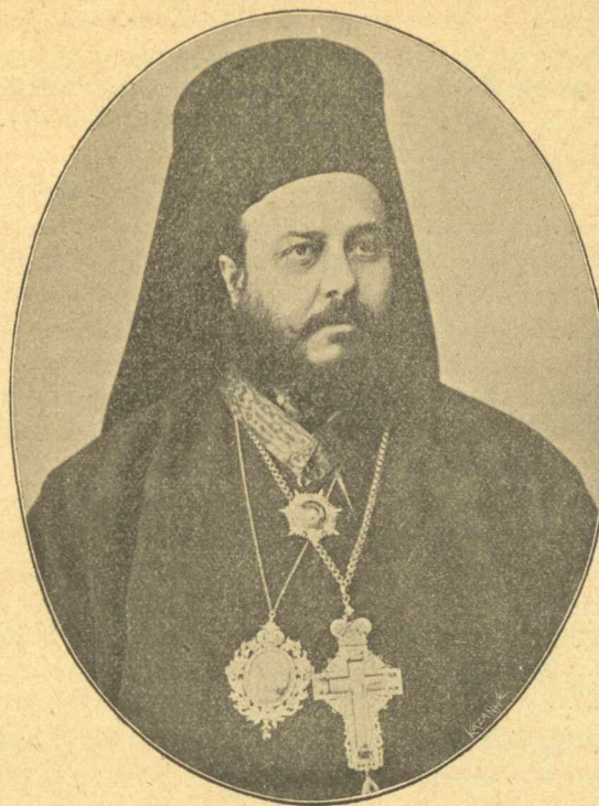
Ἡ Α. Σ. ὁ Μητροπολίτης Θραπεζοῦντος κ. Κωνσταντίας

Ἐμεινεν ὡς ἀπολιθωμένη, τοὺς ὀφθαλμοὺς ἔχουσα διεσταλμένους, τὰ χεῖλη ἡμιανοικτά, ὡς ἂν ἐβλεπε φάσμα τι, διότι εἰς τὰς κόρας τῶν ὀφθαλμῶν τοῦ Συζύγου, προσηλωμένης εἰς τὰς ἰδικὰς της, τὸ Διαφανές-Δάκρυον ἠσθάνετο διὰ πρώτην φοράν, τὴν ἰδίαν αὐτῆς εἰκόνα, τὴν ὠραίαν εἰκόνα τοῦ Ρόδου-τῶν-Ρόδων, διπλοῦν καὶ ὠραῖον φάσμα, ὅπερ ἐκλαίει βλέπον αὐτὴν κλαίουσαν, ὅπερ τῇ ἐμεριδίᾳ βλέπον αὐτὴν ἀρχομένην νὰ μεριδιᾷ... HUGUES LE ROUX