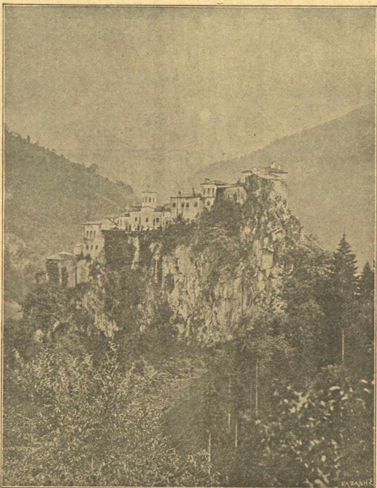
Ἡ Μονὴ τοῦ Ἁγίου Γεωργίου τοῦ Περιστερώτα (Δυτικὴ Πρόσοψις)

ματος—διότι φιλοσοφικόν σύστημα θαυμάσιον ἀποτελεῖ ὁ μοναχικὸς βίος. Τοιοῦτον ἔδαφος παρῆεν ἢ μόνωσις ἐν τόποις προσφόροις, οἵτινες σκῆται, ἢ κέλλαι, ἢ μοναστήρια ἐκαλοῦντο, μέχρι τῆς ὀριστικῆς διαμορφώσεως τῶν μετέπειτα Μονῶν. Ἐκεῖ διὰ τῆς ἡρεμίας τῆς μονώσεως, ἐν τῇ μεγαλοπρεπείᾳ τῆς φύσεως καὶ τῶν καλλωνῶν αὐτῆς, διὰ τῆς ἀπαλλαγῆς ἐκ τοῦ θορύβου τῶν πόλεων, ἐκ τῆς τύρβης τῶν κοινωνιῶν καὶ τῶν βιοτησιῶν μεριμνῶν, διὰ τῆς ἰσχυρᾶς καὶ ἐνδελεχοῦς ἐγκρατείας, διὰ τῆς συνεχοῦς μελέτης τῆς τε Χριστιανικῆς καὶ τῆς θύραθεν παιδείας, διὰ τῶν προσευχῶν καὶ συγχρόνως διὰ τῆς ἐνασχολήσεως εἰς χρησίμους γεωπονικὰς ἢ βιοτεχνικὰς ἐργασίας, ἀπεκάθαιρον, ὡς εἶπον, τὸν νοῦν καὶ ἐξύψουν τὴν καρδίαν μέχρι τοῦ Θρόνου τοῦ Ὑψίστου. Γινόμενοι δὲ σκευὴ τῆς ἀρετῆς, ἄγνοι καὶ ἄγιοι, ἐπέπνεον καὶ τοὺς περὶ αὐτοὺς Χριστιανοὺς καὶ ἐστήριζον αὐτοὺς ἐν τῇ πίστει διὰ τοῦ ἰδίου παραδείγματος. Σφαλερῶς ἄρα ὑπολαμβάνουσι τινες, ὅτι οἱ ἄνδρες ἐκεῖ-