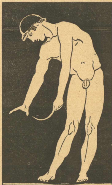
Ἀθλητὴς ἀποξυόμενος· ἐκ πυξίδος τῆς ἀκμαιοτάτης ἐποχῆς τῆς Ἰραφικῆς τῶν Ἀγγεῶν περὶ τὸ 460 π.Χ. — Ἐν Galleriā dei vasi dipinti τοῦ Museo Archeologico τῆς Φλωρεντίας.

Καὶ συμπέρασμα τῶν ἀνακωνώσεών του εἶναι ὅτι πρὸ ἡμῶν ἔχομεν πρωτότυπον ἔργον τῆς ἐνδόξου ἐποχῆς τῆς ἑλληνικῆς τέχνης, περὶ τὸ 400π. Χ. ποιηθὲν καὶ ἐξεληθὸν ἐκ τῆς ἰσχυρᾶς χειρὸς Ἀθηναίου καλλιτέχρου πιθανώτατα τοῦ Ἀλκαμένους, ὅτι ὁ παριστώμενος Ἐφηβὸς εἶναι κατὰ πᾶσαν πιθανόνητα ἀθλητὴς νικητὴς ἐν τῇ στιγμή κατ' ἣν ἐτοιμάζεται νὰ ἀποξύσῃ διὰ τῆς σπλεγγίδος, ἣν ἐκράτει ἐν τῇ τεταμένῃ ἀριστερᾷ, τὴν ὑποθεῖσαν καὶ ἐκταθεῖσαν δεξιάν χεῖρα διὰ τῆς παραβολῆς δὲ πρὸς τὰ μεγάλα χαλκᾶ ἀγάλματα τῶν ἀπανταχοῦ Μουσειῶν ἐξήχθη ὅτι τὸ κειμήλιον τοῦτο τοῦ ἐθνικοῦ ἡμῶν Μουσειῶν εἶναι ἐκ τῶν ἀρίστων.