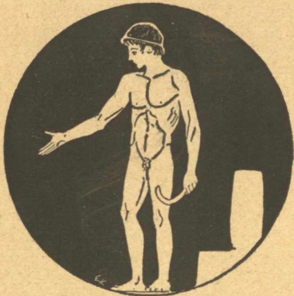
(Νεανίας κρατῶν ἐν ἀριστερᾷ σπλεγγίδι καὶ ἐκτείνων τὴν δεξιάν —ἐκ κύλικος τοῦ Ashmolean Museum τῆς Ὁξφόρδης—)

«Ὁ δυνάμενος νὰ θεωρῇ τὰ ἔργα τῆς ἑλληνικῆς τέχνης δι' ὀφθαλμῶν ἑλληνικῶν, καὶ νὰ κρίνῃ αὐτὰ ὡς θὰ ἐκρίνοντο ὑπὸ τῶν συγχρόνων αὐτῶν, οὗτος ἀληθῶς εἶναι κάτοχος τοῦ ἑαυτοῦ θέματος. Τὰ ἀρίστα δὲ μέσα πρὸς ἐπιτυχίαν τῆς ἀνεκτιμήτου ταύτης δεξιότητος εἶναι τὸ νὰ διέρχεται τις ὅσον τὸ δυνατόν πλείονα χρόνον ἐνώπιον μνημείων τῆς ἑλληνικῆς τέχνης, καὶ νὰ συγκρατῇ ἐν τῇ διανοίᾳ αὐτοῦ ὅ,τι μέγιστον ἀριθμὸν αὐτῶν».