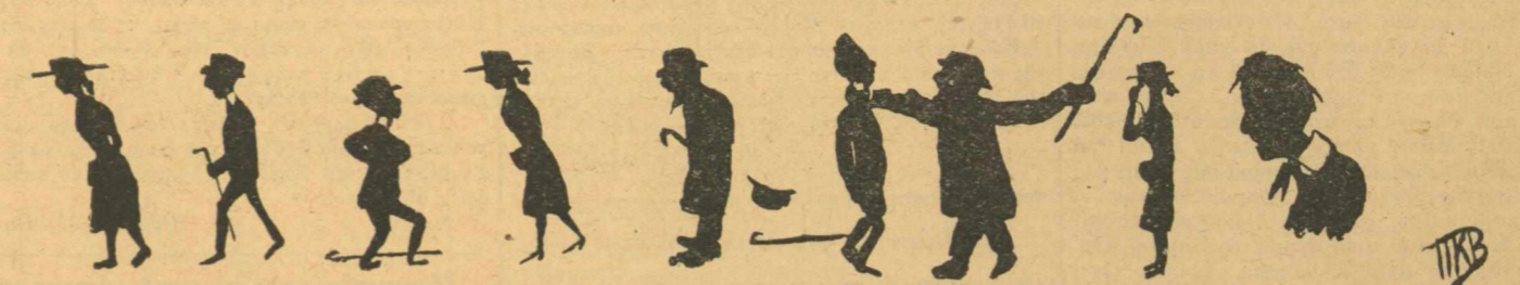
1 2 3 4 ΕΡΩΣ ΕΥΔΟΚΟΠΟΥΜΕΝΟΣ