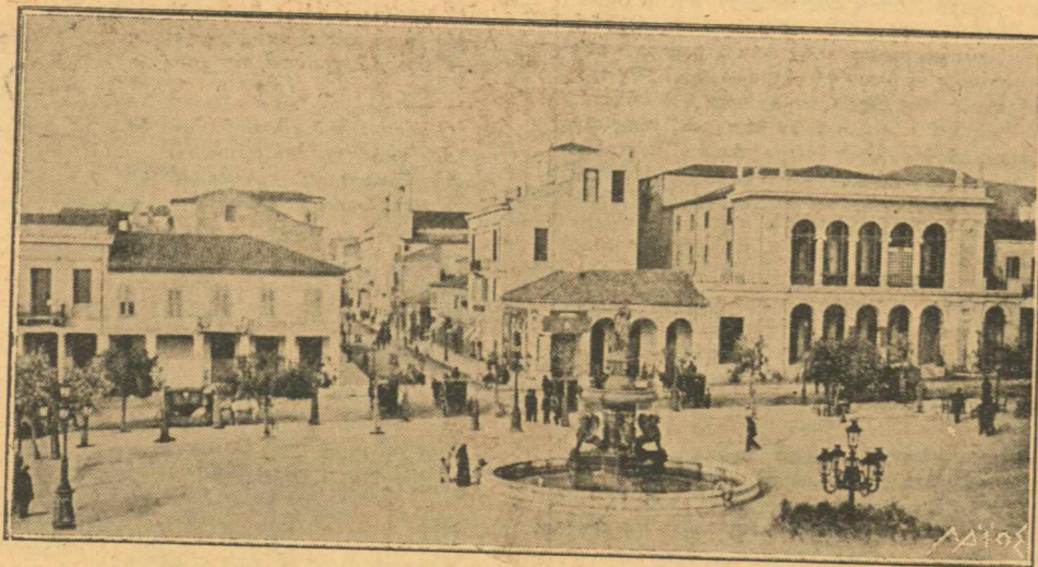
ΠΑΤΡΑΙ. — Η ΠΛΑΤΕΙΑ ΓΕΩΡΓΙΟΥ ΤΟΥ Α΄.